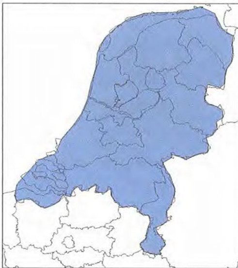
Figuur 2. Overzicht frequentieblok 12C, bestaande uit het allotment HOL2101. De punten waaruit de omtrek van het allotment is opgebouwd zijn op een USB-stick opgenomen. Deze USB-stick maakt onderdeel uit van bijlage II.

De landelijke DAB-laag 1 heeft de omtrek beschreven in figuur 2. De kavel bestaat uit GE06 T-DAB allotment HOL2101 (frequentieblok 12C).