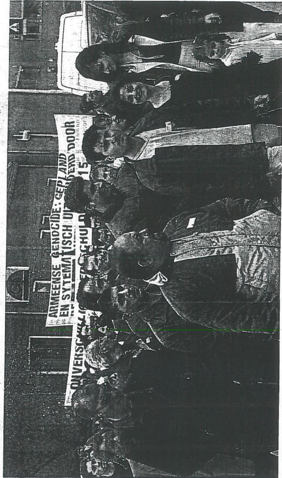
De Armeense demonstratie in het centrum van Assen.

Boosheid was er over de censuur die door burgemeester en politie op de spandoeken was toegepast. Volgens een woordvoerder van de Armeense gemeenschap was men dat niet gewoon in Nederland. "Wij zijn het niet ge-