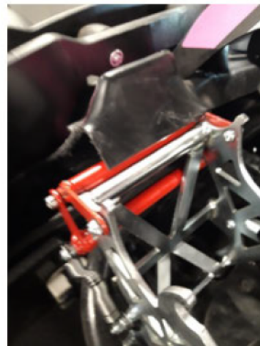
6: situatie rond rempedaal na het incident