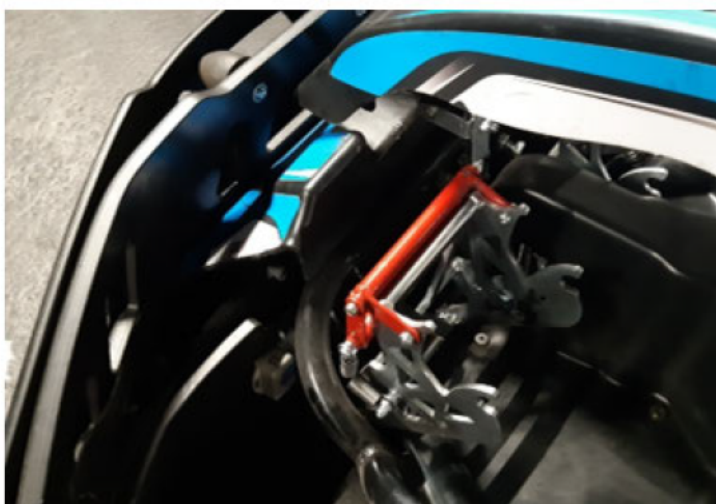
7: Normale situatie rond het rempedaal

Het leek mij meer voor de hand liggen dat dit kunststof, bij indrukking van de stootdemper door bijvoorbeeld een frontale botsing met de baanafzetting, tegen de achterzijde van het ingedrukte rempedaal komt er vervolgens overheen schuift en uiteindelijk de situatie zoals op de foto zou kunnen opleveren.