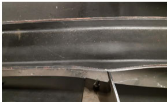
8: Plastische deformatie van de Baanafzetting na impact van de rijder

Wat mij bij deze kartbaan ook opviel is dat hier op veel plaatsen een deflecterende baanafzetting wordt gebruikt en op sommige plaatsen, meestal buitenzijden van bochten ook een energie adsorberende afzetting gebruikt wordt. Op de plaats van het incident daarentegen, ook de buitenzijde van een bocht was enkel een deflecterende baanafzetting toegepast. Door de impact van de botsing was een stalen H-Balk die de basis vormt van deze afzetting verbogen. Had hier een adsorberende baanafzetting gestaan was het letsel, desondanks de fout van de rijder, hoogstwaarschijnlijk minder ernstig geweest.