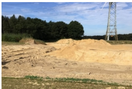
1: Vergraving rond hoogspanningsnet, oost-aanzicht