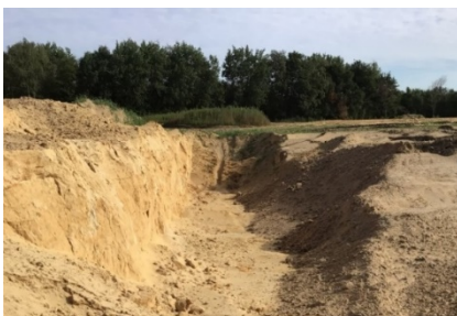
3: Vergraving rond hoogspanningsnet, diepte circa 2 m