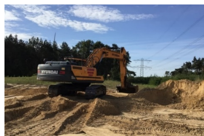
4: Graafmachine bij vergraving rond hoogspanningsnet