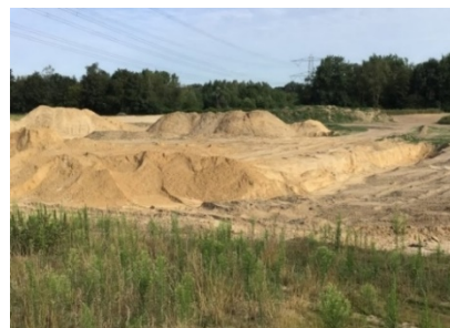
2: Vergraving rond hoogspanningsnet, zuid-aanzicht