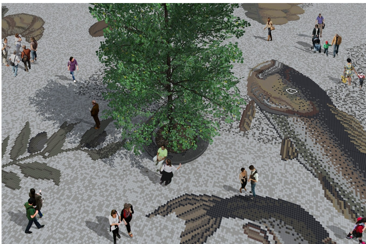
Mozaïekdetail met nieuwe boom in het midden van het plein