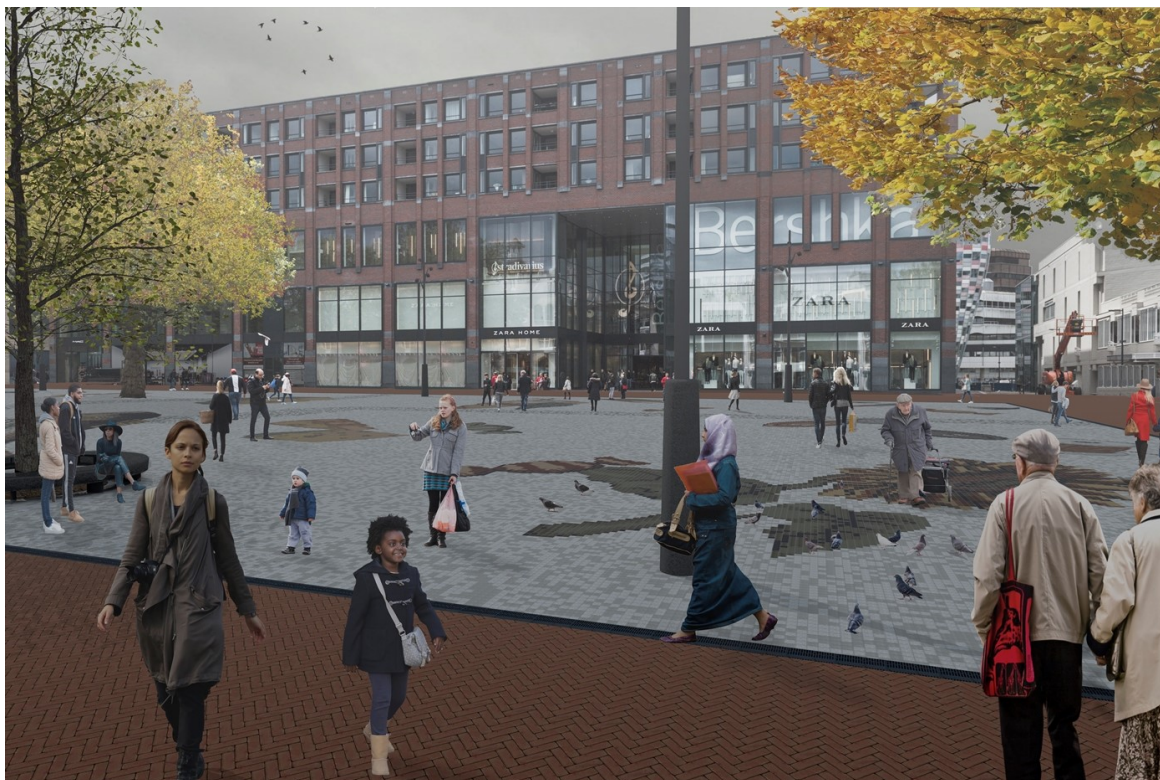
Beeld op ooghoogte gezien vanaf Esprit