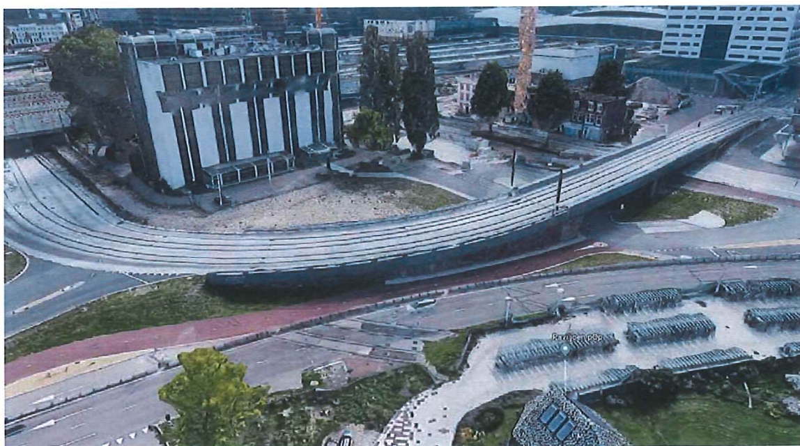
Overzichtsfoto fly-over perspectief ULU-moskee