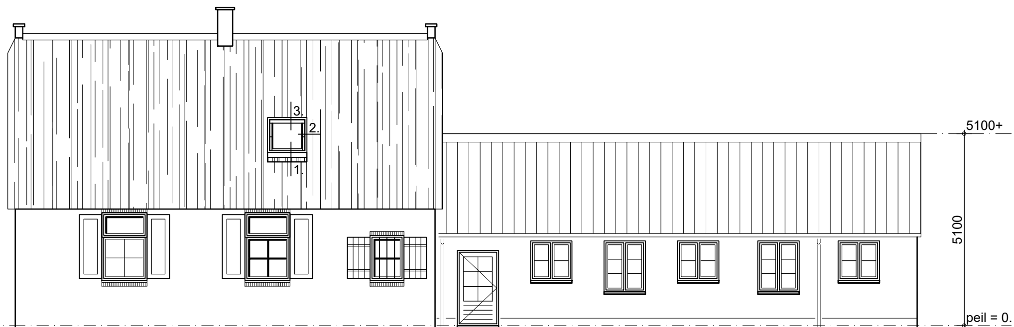
Velux dakraam. 942x1178 mm. oostgevel gewijzigd.