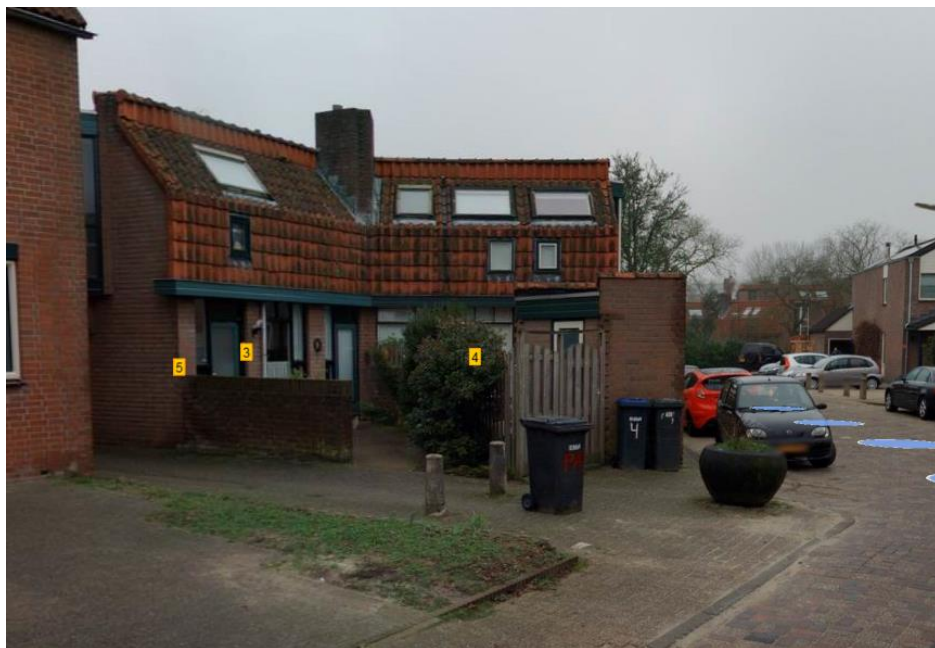
Figuur 1: Voortuin van nummer 5, de situatie voorafgaand aan de herinrichting