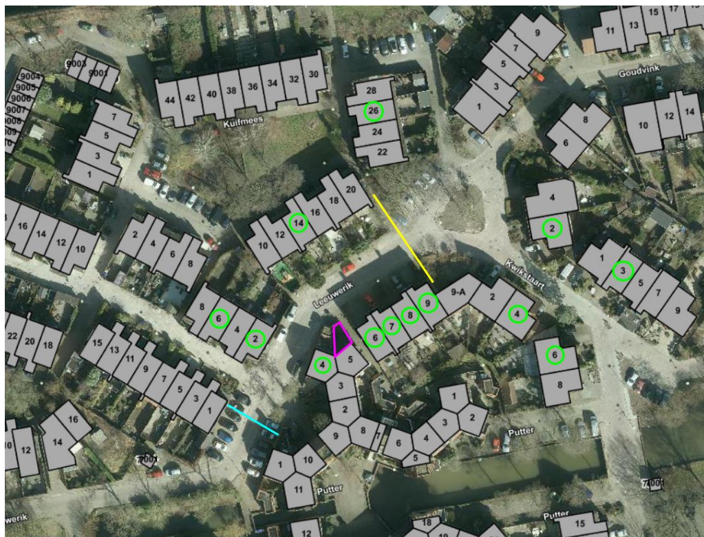
Figuur 3: Adressen bezwaarmakers (groen omcirkeld) t.o.v. locatie uitweg (paars omlijnd).

Wij zien geen redenen om te twijfelen aan de belanghebbendheid. Het bezwaar is volgens ons ontvankelijk.