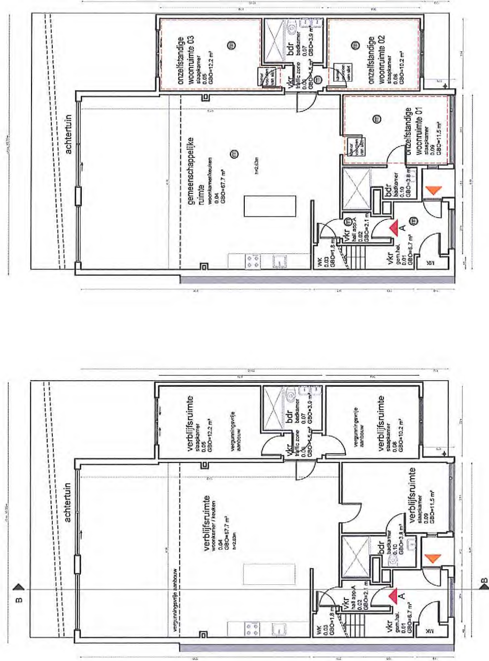
Begane Grond - bestaande situatie