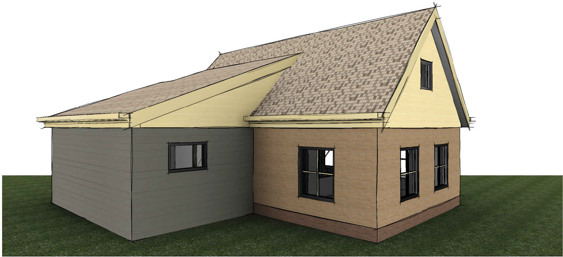
3D View 1