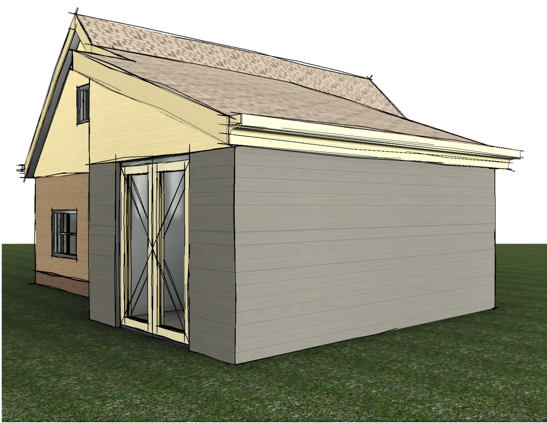
3D View 3