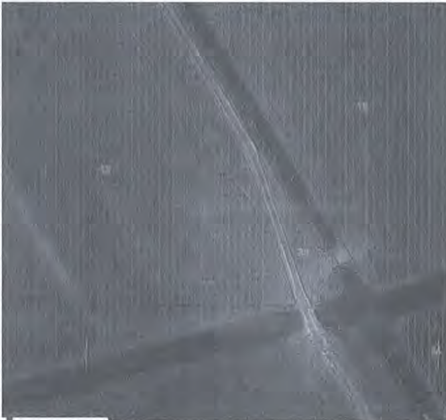
Foto controle oppervlakte perceel 12.