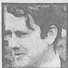
★ Directeur Van Deth: kans op beroerde fouten...