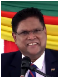
Chan Santokhi President van Suriname

U heeft een gesprek met de Surinaamse President, Chan Santokhi (PM Paleis of Kabinet President)