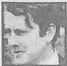
★ Directeur Van Deth: kans op be-roerde fouten...