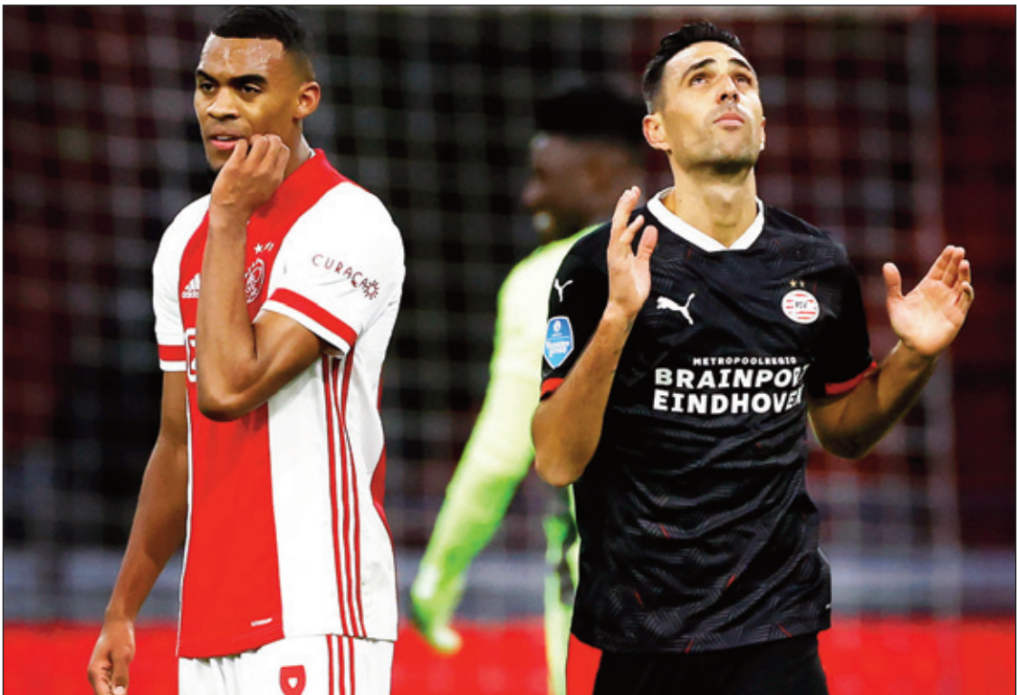
Zowel Ajax als PSV strijdt nog om de landstitel, de KNVB-beker en winst van de Europa League.

van de Europa League. Van die drie uitdagingen heeft het nationale bekertoernooi voor beide clubs het minste aanzien, al blijft Schmidt herhalen dat het hoog tijd wordt dat PSV na 2012 weer eens de KNVB-beker wint. Ajax won in 2019 de laatste afgeronde editie van het bekertoernooi. Trainer Erik ten Hag beschouwt de KNVB-beker als een prijs, maar liet in de vorige ronde tegen AZ wel acht andere spelers beginnen. Dat heeft hij in een Europees duel of competitiewedstrijd nog nooit gedaan. Voor Ajax is de bekerkraker tegen PSV het eerste duel na een regelrechte rampweek. Record-