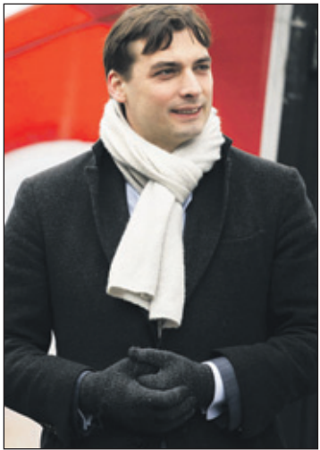
In een video op het YouTube-kanaal van FVD reageerde Baudet op de ophef. Hij spreekt in de video van 'al dan niet vervalste screenshots'.

Daarbij ziet eenzelfde percentage docenten dat leerlingen achterstanden hebben opgelopen, soms zelfs forse.