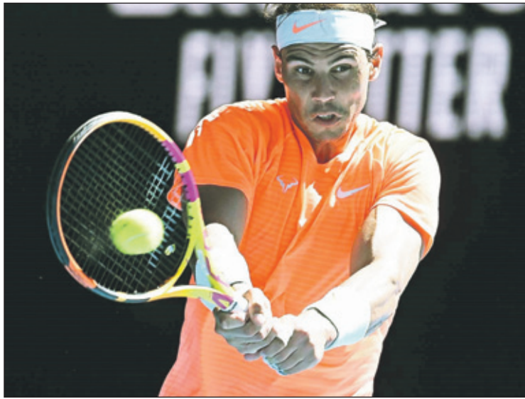
Nadal: „Het waren vijftien lastige dagen voor me met de zorgen om mijn rug, dus ik moest overleven vandaag.”

MELBOURNE - Rafael Nadal heeft zich zonder setverlies verzekerd van een plek in de tweede ronde van de Australian Open. De als tweede geplaatste Spanjaard was in een uur en 52 minuten met 6-3 6-4 6-1 de Serviër Laslo Djere, de mondiale nummer 56, de baas. Voor de 34-jarige Nadal was het zijn eerste wedstrijd van het jaar. In aanloop naar de Australian Open zou hij deelnemen aan de ATP Cup, maar op het landentoernooi kwam hij vanwege rugproblemen niet in actie. In zijn eerste partij leek Nadal weinig last te hebben van zijn rug. „Het waren vijftien lastige dagen voor me met de zor-