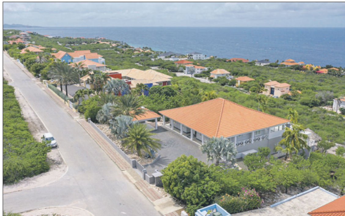
Partijen in het bestuur van Coral Estate hebben elkaar als bestuurder geschorst.

kort geding aangespannen. De vorderingen houden in dat de wederpartij de hem door de eisende partij opgelegde schorsing eerbiedigt en zich onthoudt van het uitvoeren van bestuurstaken en het verrichten van handelingen namens de VvE, totdat de leden zich op een algemene ledenvergadering (ALV) hebben uitgesproken over de schorsing en over het al dan niet aanblijven van het desbetreffende bestuurslid.