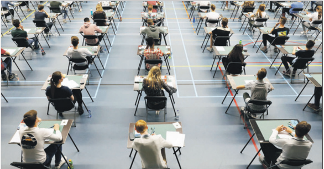
Minister Slob stelde in december voor om eindexamenleerlingen vanwege de coronacrisis meer ruimte te geven om hun examens te doen.

Na de invoering van de avondklok kwam het in meerdere steden tot zware rellen.