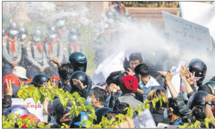
De politie greep in meerdere steden hard in en gebruikte ook traangas en waterkanonnen.

Volgens de staatstelevisie zijn politiemensen gewond geraakt toen ze 'agressieve' demonstranten probeerden te verspreiden. Ook zou een politievoertuig zijn vernield. Een groep agenten viel toen het donker was geworden in de grootste stad Yangon het hoofdkwartier binnen van Aung San Suu Kyi's partij, de Nationa-