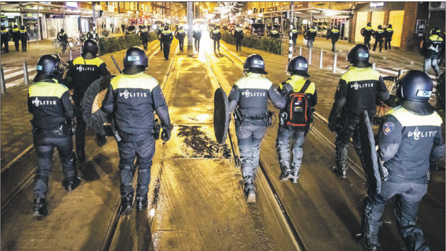
De avondklokrellen in Nederland begonnen met opruiende oproepen op de sociale mediaplatforms.