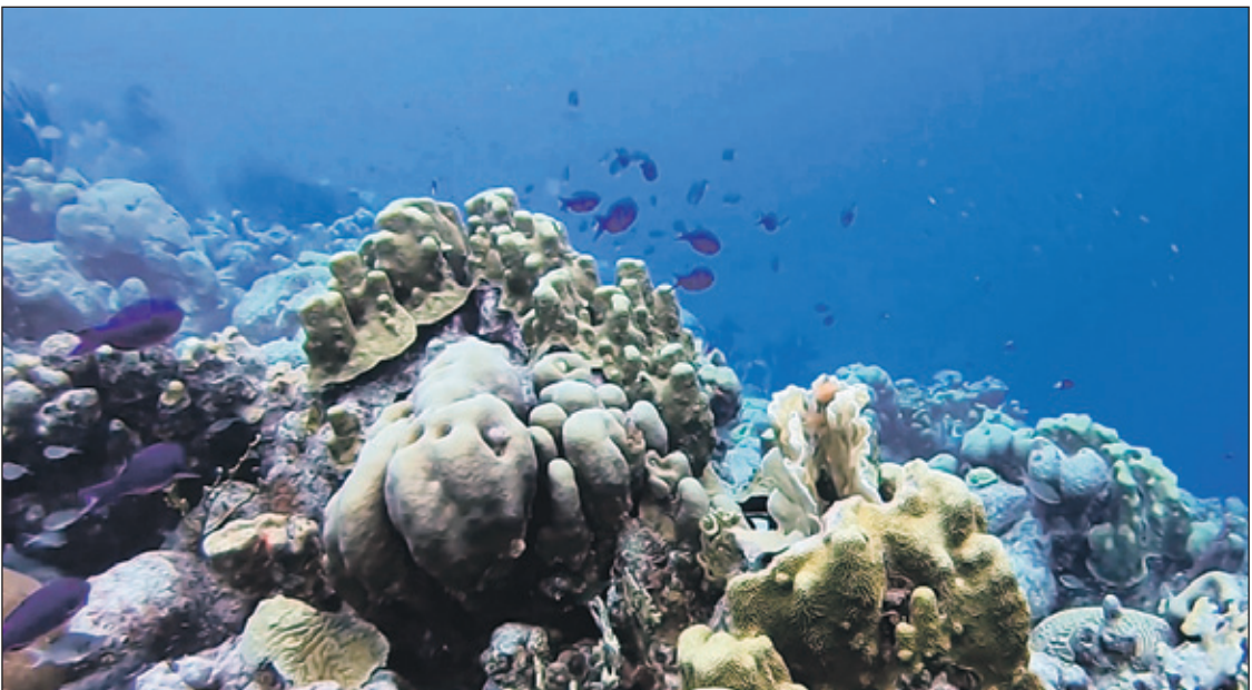
Zo ziet volgens Conserve Bonaire het Hato-rif eruit. De maker van de beelden ontkent echter dat de opnames daar gemaakt zijn.

oordeeld wat de uitwerking van de gekozen aanpak is en waar de behoefte aan intensivering is'. In de tweede fase tot 2030 zullen de volgende 'strategische doelen' in gang worden gezet. Ook zal er niet overal op Bonaire, Sint Eustatius en Saba afvalwaterzuivering en riolering komen, antwoordt Schouten op de tweede vraag of hiervoor voldoende geld beschikbaar is. Ze herhaalt het antwoord op de eerste vraag dat in de eerste fase tot 2024 alleen de meest urgente en veelbelovende doelen worden gerealiseerd. „Meer onderzoek is noodzakelijk naar effectieve strategieën voor de afzonderlijke eilanden voor afwaterbeheer.” Net als voor de natuur zal ook voor de afvalwaterzuivering in 2025 worden geëvalueerd wat de juiste aanpak is.