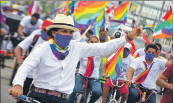
Met 98 procent van de stemmen geteld staat Pérez op 19,8 procent, net voor de 65-jarige bankier Lasso (19,6 procent).

Een man die tot de Cañari behoort, een gemeenschap van enkele duizenden mensen werd geboren als Carlos, maar veranderde in 2017 zijn naam naar Yaku Sacha, de woorden ‘water’ en ‘berg’ in de inheemse taal Kichwa. Maandag claimde hij zijn plek in de tweede ronde en riep op tot het ‘openen van de