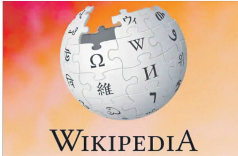
Wikipedia heeft onlangs voor het eerst een universele gedragscode opgesteld.

Het recht op vrijheid van meningsuiting is een grondrecht dat van groot belang is in een vrije democratische samenleving. Op Curaçao wordt de vrijheid van meningsuiting op het internet geregeld in het derde lid van artikel 9 van de Staatsregeling en artikel 10 van het Europees Verdrag voor de Rechten van de Mens (EVRM). De vrijheid van meningsuiting is vooral belangrijk omdat het ruimte geeft om kritiek te uiten.