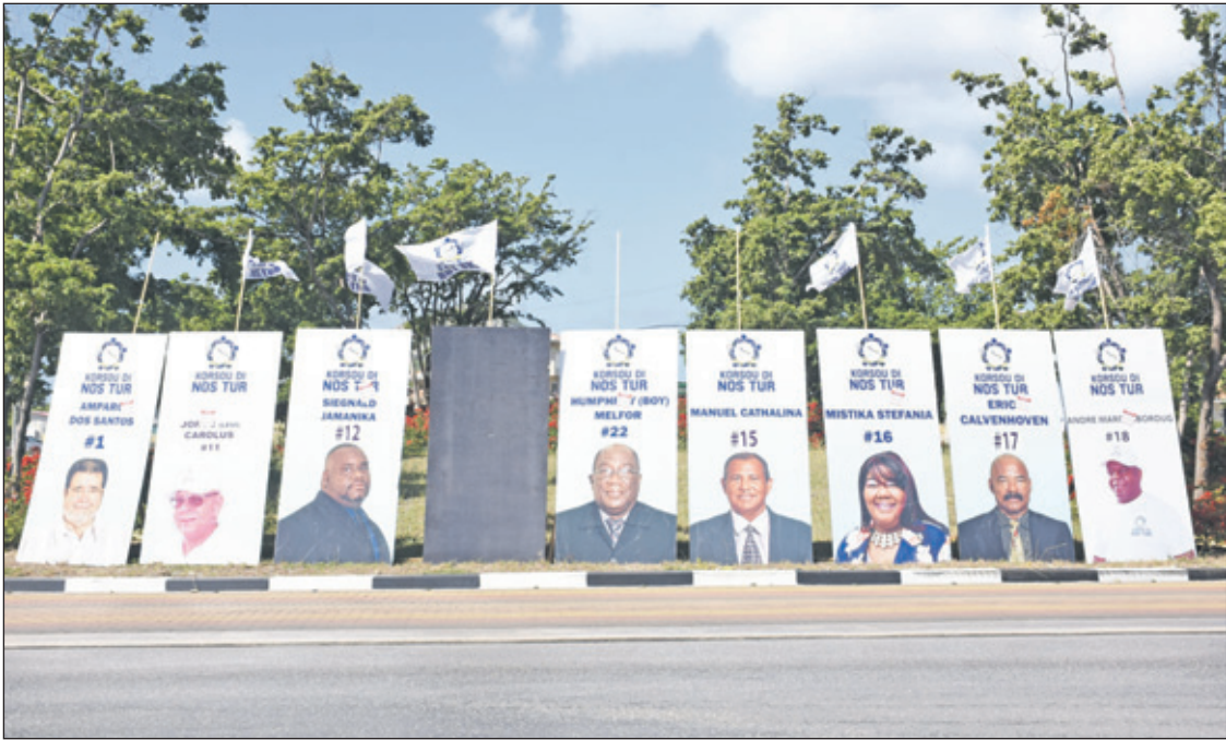
Op bevel van het ministerie van VVRP moeten deze borden van Korsou di Nos Tur bij de rotonde Hariri (Palu Blanku) binnen twee weken worden verwijderd.

Ordering en Planning (ROP) hebben maandag op verschillende plekken, waaronder de rotonde Hariri en bij Saliña, ingegrepen. Met stickers laat de dienst weten dat de betreffende reclameborden binnen twee weken verwijderd moeten worden. Volgens ochtendkrant Extra kon ROP niet overal waar nodig in-