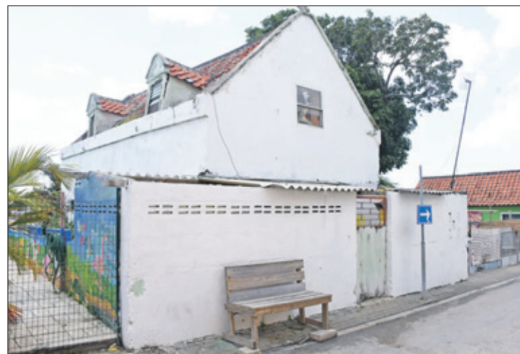
Nadat zij het monumentale pand aan de Quintastraat vijftig jaar heeft beheerd en verhuurd, wordt de kleindochter van de in 1933 overleden schoenmaker Jan Mullers dan toch nog de officiële eigenaar.

Het gerecht in eerste aanleg oordeelt dat de kleindochter aan alle wettelijke eisen voldoet om haar aan te wijzen als 'gebruiker van de onroerende zaak