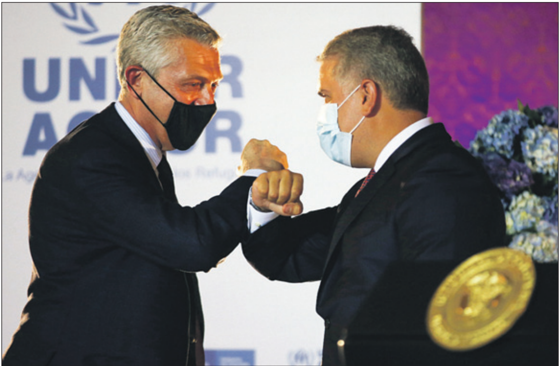
De beslissing werd aangekondigd na een werkoverleg tussen de president en de VN-commissaris voor de Vluchtelingen, Filippo Grandi.

Ongeveer 1 miljoen van de 1,7 miljoen Venezolanen in Colombia verblijven daar op dit mo-