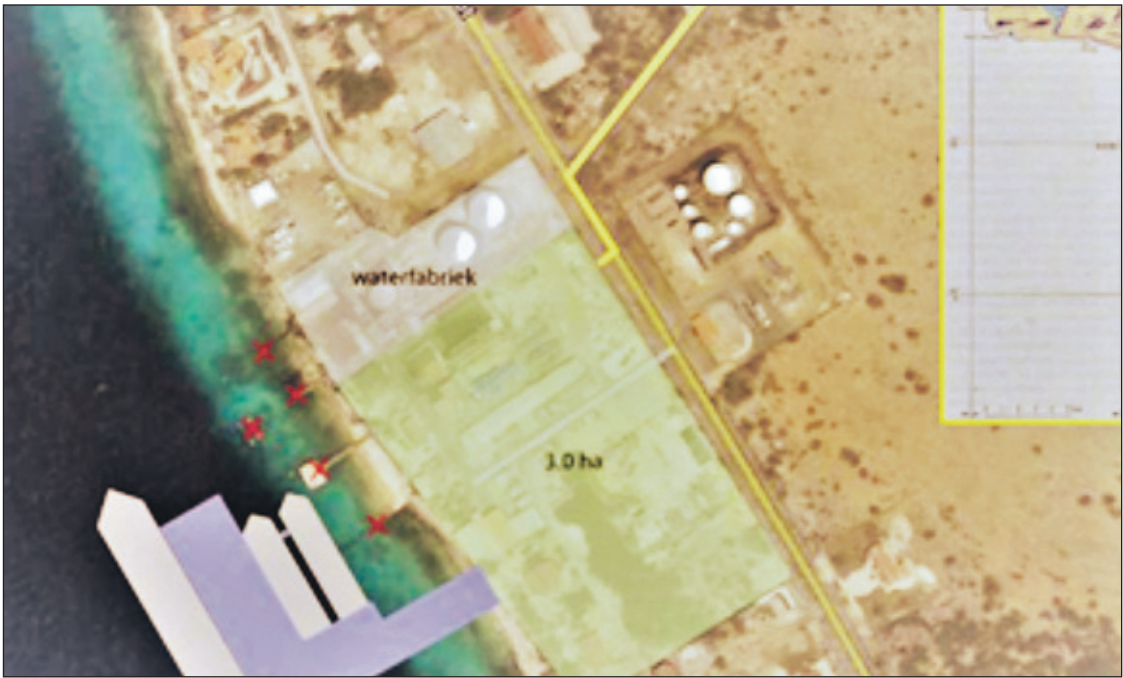
De situatie bij Hato zoals die in het rapport uit 2010 geschetst is.

Maar om een toekomstbestendige haveninfrastructuur die meegroeit te krijgen, is volgens hen meer nodig. „Het combineren van cruisevaart en vrachtafhandeling is niet mogelijk, voor het lossen van containerschepen is een havenkraan nodig die niet op de huidige zuidpier ingepast kan worden en het almaar groeiende vrachtverkeer van en naar de haven botst met het andere verkeer in het drukste deel van Kralendijk.” Het uit elkaar halen van deze verkeerstromen en het verbete-