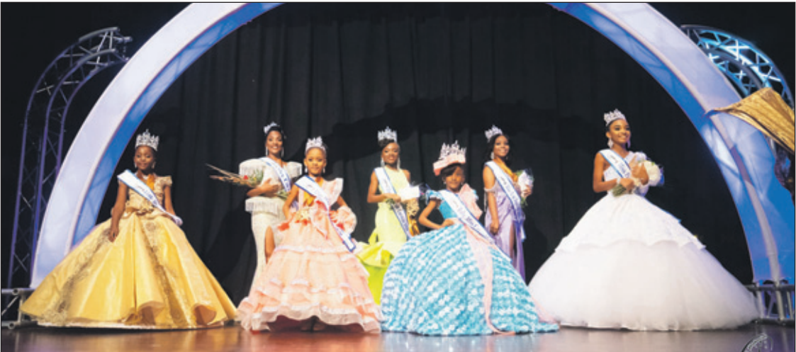
Na bijna een jaar van voorbereidingen, verschillende workshops en fotosessies, konden afgelopen zondag de kandidaten in de verschillende schoonheidscategorieën de strijd met elkaar aangaan voor de eretitel. Alleen ouders van de deelnemers waren in de zaal toegestaan. Er zijn winnaars uitgeroepen in de categorieën Baby Miss Curaçao, Mini Miss Curaçao, Little Miss Curaçao, Miss Pre-Teen Curaçao, Miss Teen Tourism Curaçao, Miss Tourism Curaçao en Mrs. Curaçao.