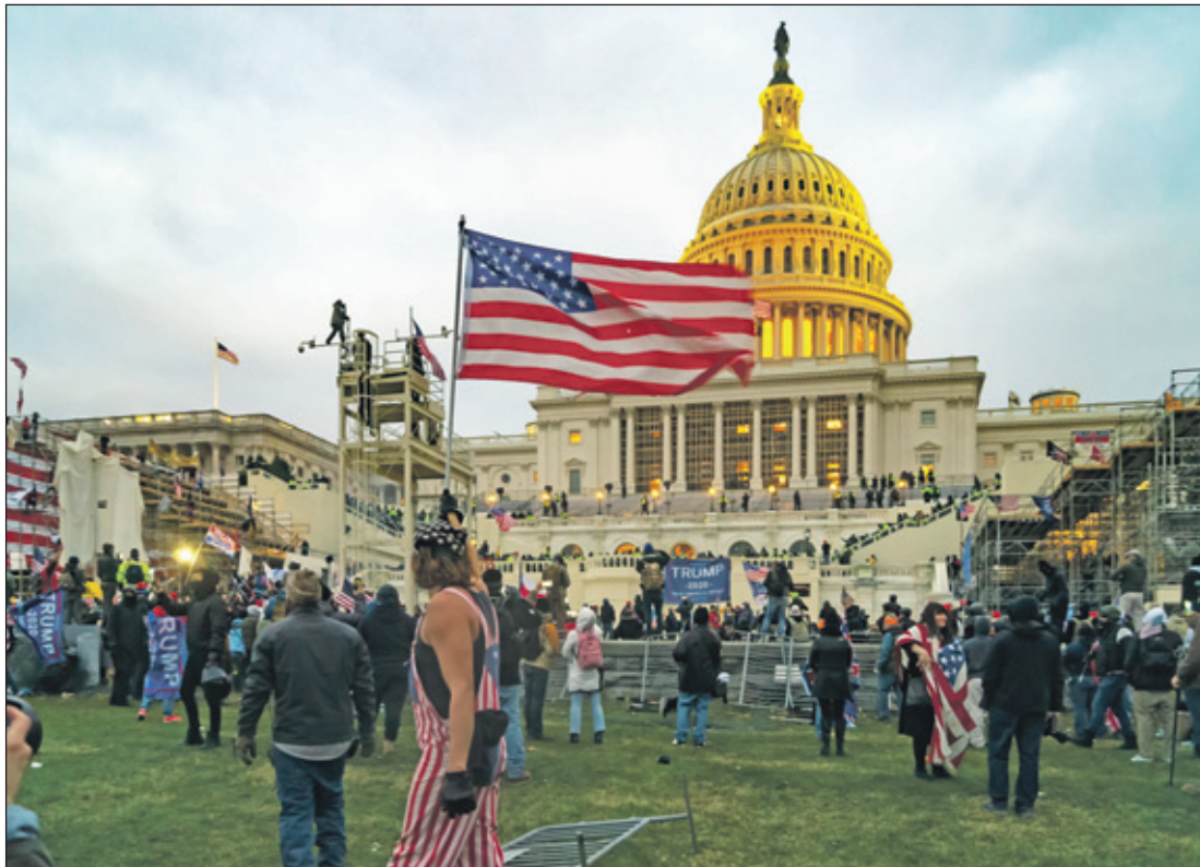
Die bestorming van het Capitool werd, volgens waarnemers, door de voormalige Amerikaanse president Donald Trump aangezet op de sociale media.