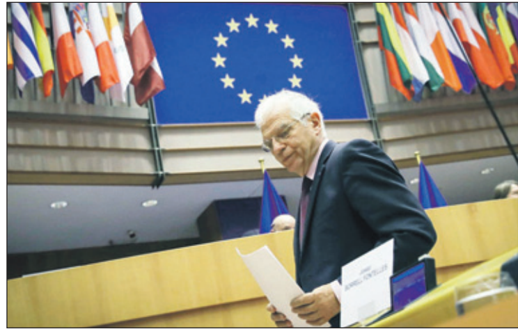
Borrells bezoek aan Moskou was op voorhand al omstreden.

Zijn collega John Cornyn was eveneens niet onder de indruk. „Ik heb een hoop advocaten en een hoop betogen gezien en dit was niet een van de beste.” Hij was net als anderen vooral vernietigend over Castor. Hij 'bazelde maar door en door en door'. De Texaan veranderde in tegenstelling tot zijn collega uit Louisiana niet van mening over de grondwettelijke basis voor de zaak.