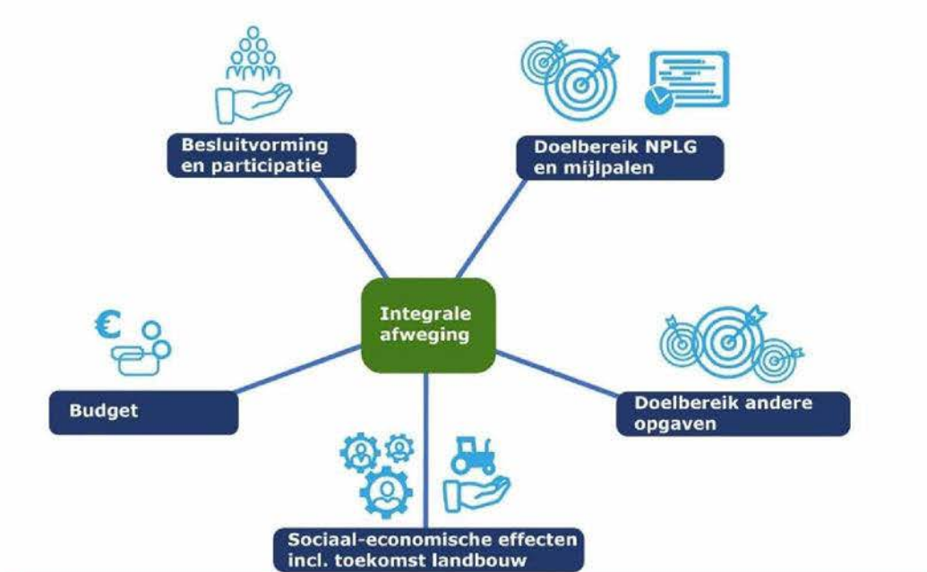
Figuur 2: Integrale afweging toetsingskader