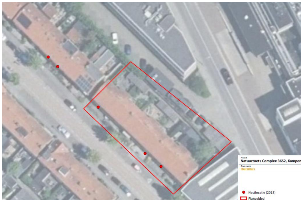
Figuur 1 – nestlocaties huismus