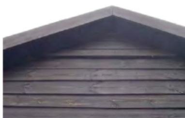
Figuur 17: Voorbeeld van gevelbetimmering welke geschikt is als verblijfplaats voor gewone dwergvleermuizen.

Verblijfplaatsen kunnen ook worden gerealiseerd door het aanbrengen van bij voorkeur meerlaagse gevelbetimmering (figuur 17) of een plaat tegen de gevel zodat een ruimte van enkele vierkante meters wordt gecreëerd. Zowel de buitenmuur als de binnenzijde van de plaat of planken moeten ruw zijn. Als het een gladde buitenmuur betreft moet eerst een ruwe achterwand bevestigd worden. Met latjes kan/kunnen plaat/planken zodanig worden bevestigd, dat aan de onderzijde een ruimte ontstaat van ongeveer 3 centimeter en aan de bovenzijde 1,5 centimeter. Het materiaal moet eveneens op voldoende hoogte (minimaal 3 meter) worden aangebracht.