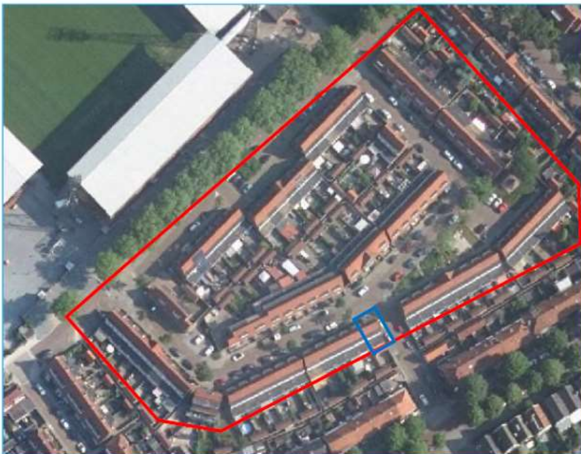
Figuur 1. Situering plangebied. Hof van Colmschate 48 (blauwe kader), gelegen in het plangebied dat in 2017 is onderzocht. (rode kader)

De woning maakt deel uit van een groter plangebied. Het plangebied ligt in de bebouwde kom van Deventer en betreft diverse woningen aan de Vetkampstraat, 2de Vetkampdwarsstraat en het Hof van Colmschate. De woningen vallen bij Rentree onder complex 280. Het is een weinig groene wijk. De daken hebben geen overhellende nok- en gevelpannen, ze zijn afgesneden en dichtgemetseld. De spouwmuren zijn geïsoleerd.