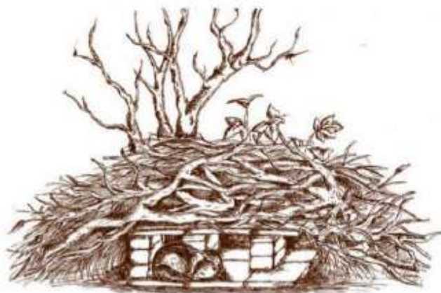
Figuur B3.1 Een tekening van een vervangende steenmartenverblijfplaats zoals voorgesteld door de zoogdiervereniging.