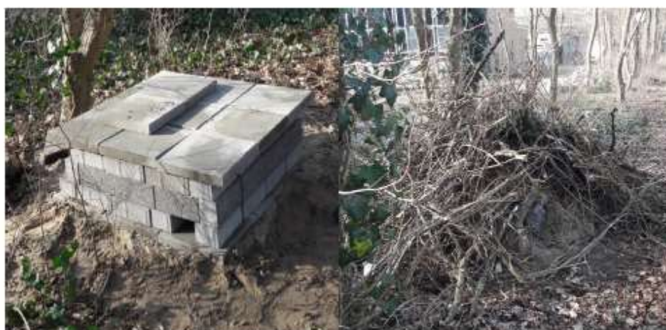
Figuur B3.2 Voorbeeld van een steenmartenverblijfplaats, met een fundering van stenen (links) en afgewerkt met takken (rechts).