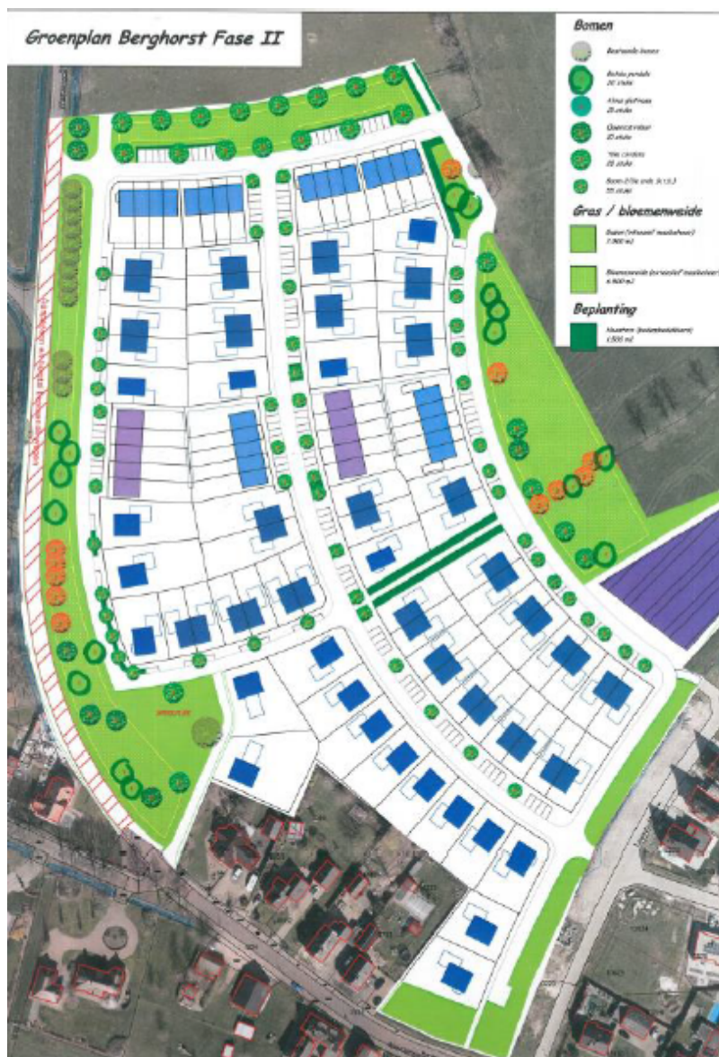
Figuur 3: Groenplan met daarin de permanente mitigatie voor de egel