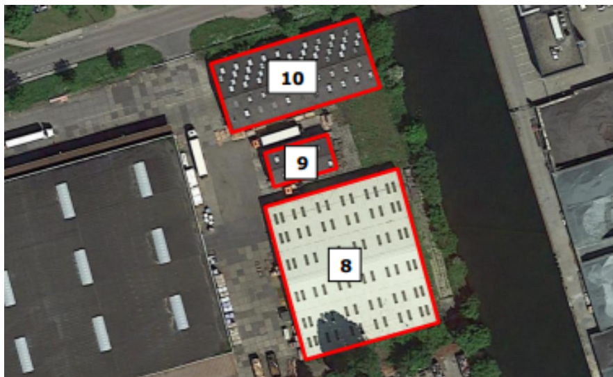
Figuur 2: Locaties van de te slopen loodsen aan de Duurstedeweg 2 te Deventer.

Het aangevraagde project omhelst het slopen van 3 loodsen aan de Duurstedeweg 2 te Deventer (Figuur 2).