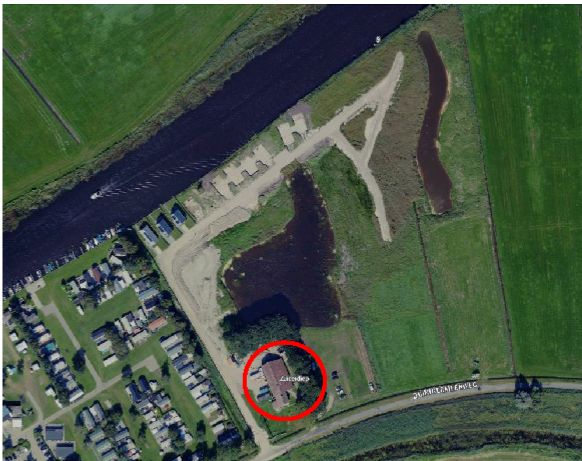
Figuur 1. Ligging te verbouwen boerderij tot receptiegebouw.