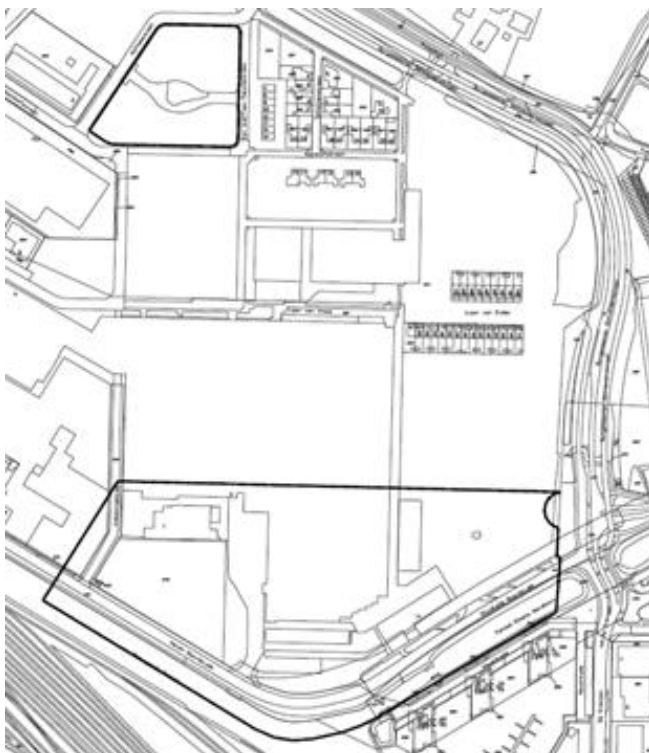
Afbeelding: ligging en begrenzing projectlocatie

Het Indiëterrein is gelegen ten noordwesten van het huidige centrum van Almelo. Het gehele (inbreidings-)gebied Indië wordt gefaseerd ontwikkeld. Het plangebied "Woongebied Indië - Deel 3" ligt voor een groot deel aan de zuidkant van het Indiëterrein, ten noorden van de Haven Noordzijde. De zone omvat voor het grootste deel het restgebied van het Indiëterrein, waarvoor nog geen bestemmingsplan voor de beoogde ontwikkelingen was vastgesteld. Daarnaast ligt een deel in het noorden van het woongebied en maakte eerder deel uit van het bedrijventerrein in het bestemmingsplan "De Velden". Onderstaande illustratie geeft de begrenzing van het plangebied weer.