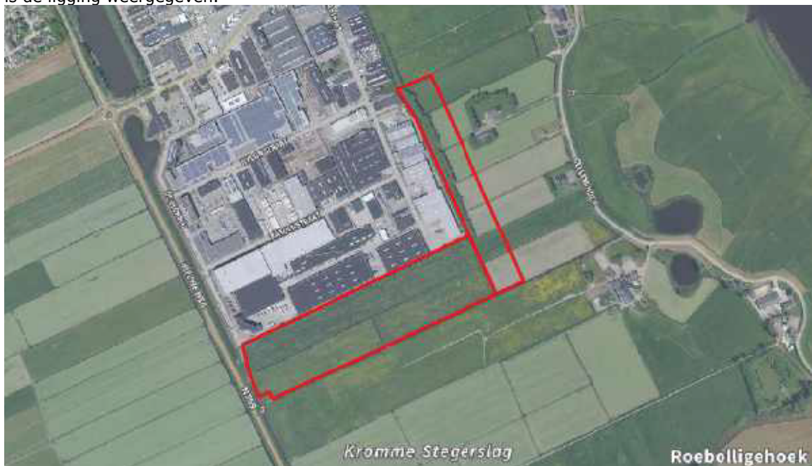
Figuur 1. Ligging plangebied (zuidelijke en oostelijke deelgebied).

De aanvraag betreft het uitbreiden van het bedrijventerrein op de locatie Zevenhont-Midden, gelegen tussen het bestaande bedrijventerrein en een uitbreidingslocatie Zevenhont-Zuid. In onderstaande figuur is de ligging weergegeven.