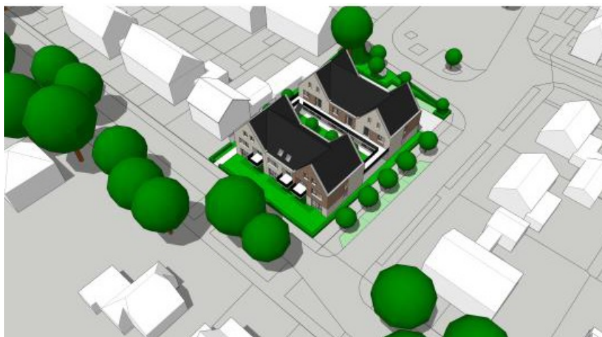
Impressie toekomstige situatie met nieuwbouw

De start van de sloop van de huidige bebouwing in het plangebied zal ofwel voorafgaand aan de start van het broedseizoen van de huismus in februari 2023 plaatsvinden, of in het najaar van 2023 na afloop van het broedseizoen van de huismus. Na de sloop vindt nieuwbouw plaats. De eerste woningen zullen naar verwachting in 2024/2025 gereed zijn. Dit is echter afhankelijk van de voortgang van de procedures.