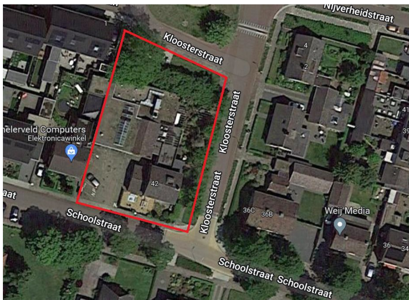
Huidige locatie plangebied is rood omlijnd.

Het plangebied ligt in het stedelijk gebied van Lemelerveld. Het betreft een perceel met enkele bedrijfshallen en een (bedrijfs-)woning aan de Schoolstraat 42 in Lemelerveld. De huidige bebouwing in het plangebied wordt gesloopt en vervolgens worden 3 seniorenwoningen en 6 startersappartementen.