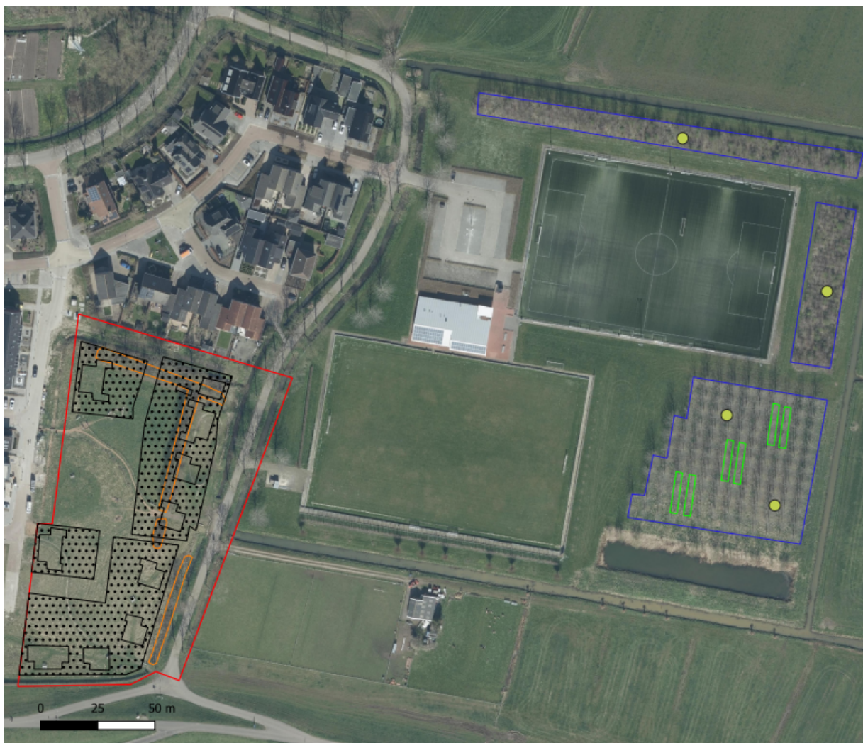
Figuur 3: Mitigatieplan, met rood omrand het projectgebied, met daarin in zwart de voorgenomen inrichting en oranje omrand het huidige leefgebied van de egel. Blauw omrand het ter mitigatie verbeterde leefgebied voor de egel, met groen omrand de locaties waar inheemse planten worden aangeplant. De gele stippen geven de locaties van de takkenrillen met egelhuisjes weer.