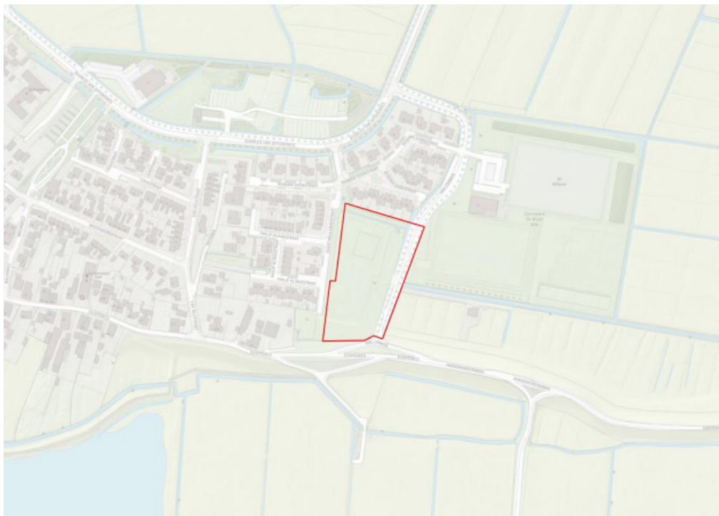
Figuur 2: De locatie van het projectgebied aan de Koert Meulenmanstraat in Wilsum.

Het project omhelst het realiseren van 20 nieuwe woningen aan de Koert Meulenmanstraat in Wilsum (Figuur 2). Werkzaamheden omvatten onder andere het bouwrijp maken van het terrein en het bouwen van de woningen. De werkzaamheden starten in april 2023.