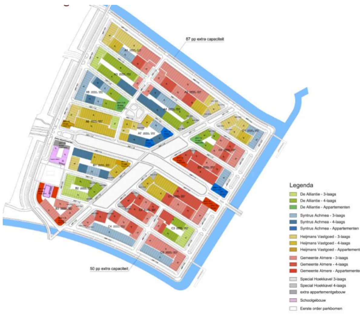
Figuur 2 Europakwartier in zijn geheel.

Doel van de ontgronding is het aanleggen van een infrastructuur als riolering, kabels en leidingen. Voor de aanleg van riolering, kabels en leidingen zal de ontgronding gefaseerd plaatsvinden. Ter plaatse is in een eerder stadium een tijdelijke voorbelasting van zand aangebracht en deze zal met de ontgraving verwijderd worden. De hoeveelheden van de te ontgraven voorbelasting zijn ook meegenomen in de berekening.