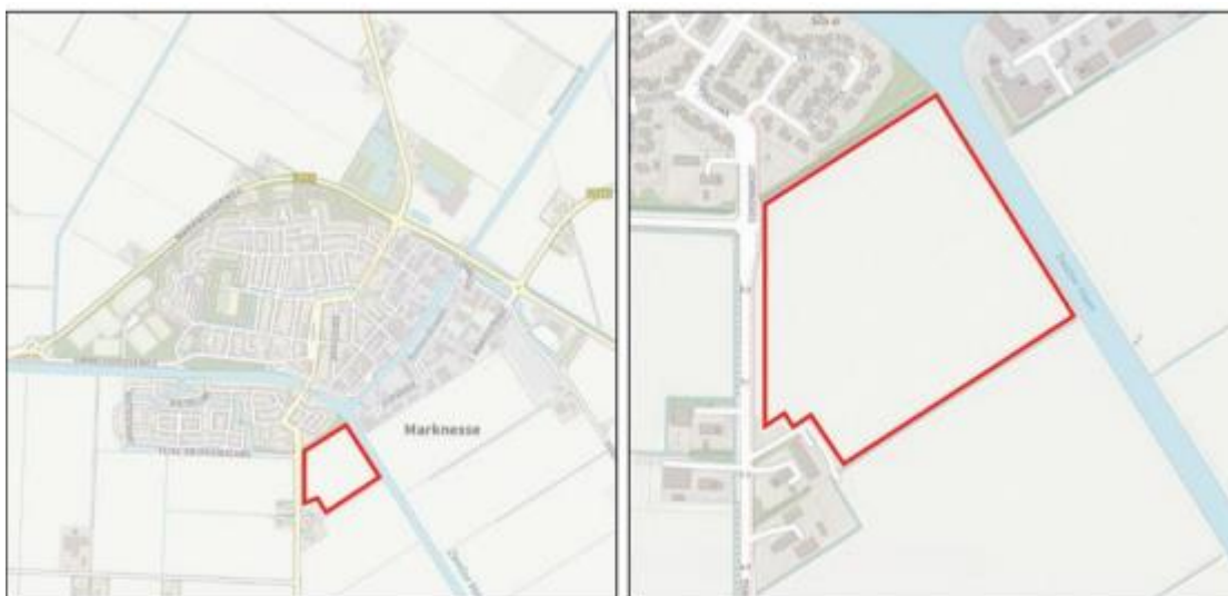
Figuur 1: Ligging van het projectgebied

Het doel van de ontgronding is de aanleg van een cunet voor het realiseren van nieuwe verhardingen voor de nieuwbouwwijk op deze locatie, zowel als het ontgraven van watergangen en een waterberging. Voor zowel de aanleg van de cunetten als het ontgraven van de watergangen en waterberging zal worden ontgraven met een hydraulische graafmachine. De werkzaamheden zullen plaatsvinden aan de Leemringweg in Marknesse.