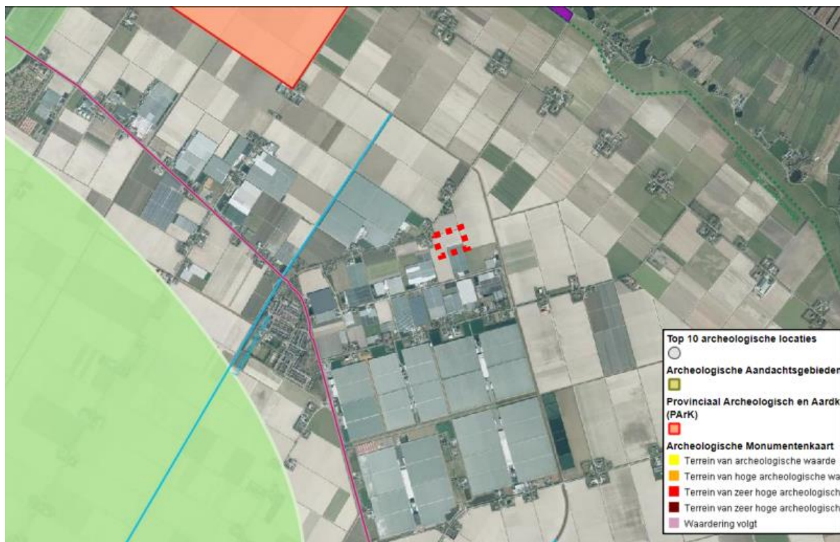
Figuur 1: Ligging van het projectgebied

De ontgroning zal worden gerealiseerd op de kadastrale percelen: gemeente Noordoostpolder, sectie B, nummers: 2224 en 3014