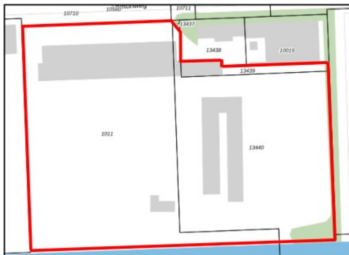
Figuur 3: Gevalscontour (rode omlijning)

Voor 1987 zijn als gevolg van de bedrijfsmatige activiteiten ter plaatse verontreinigingen ontstaan. Deze zijn onderdeel van een geval van bodemverontreiniging. De gevalscontour beperkt zich tot de onderzoeklocatie, kadastraal bekend onder gemeente Noordoostpolder, sectie AZ, perceelnummers 1011, 13439 en 13440 (zie rode omlijning figuur 3).