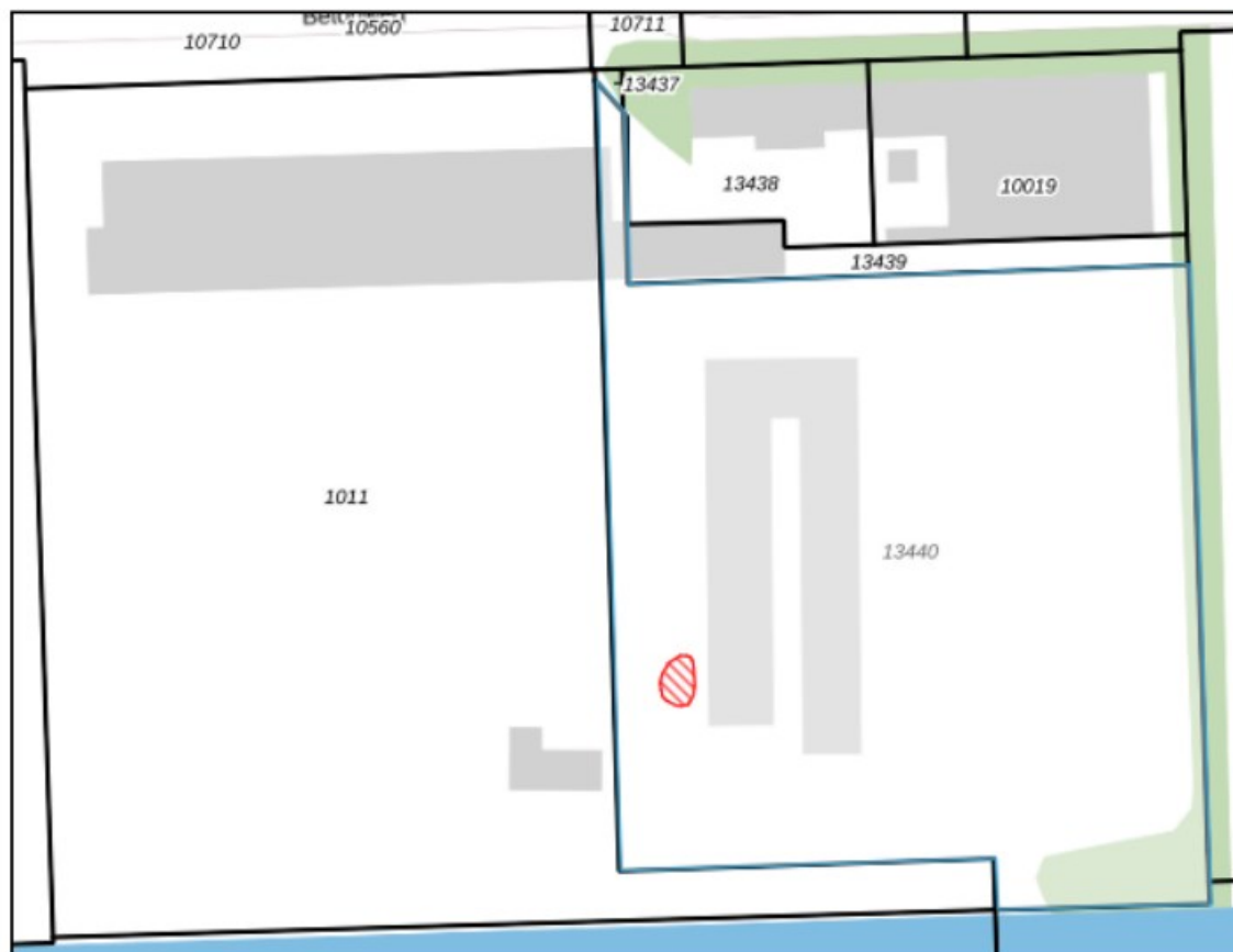
Figuur 4: Verontreinigingscontour boven de interventiewaarde

De interventiewaardecontour van de verontreiniging met minerale olie en som xylenen in de grond (rode arcering) is weergegeven op de onderstaande kadastrale kaart.