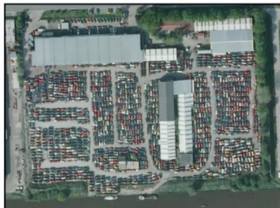
Figuur 2: Luchtfoto 2021