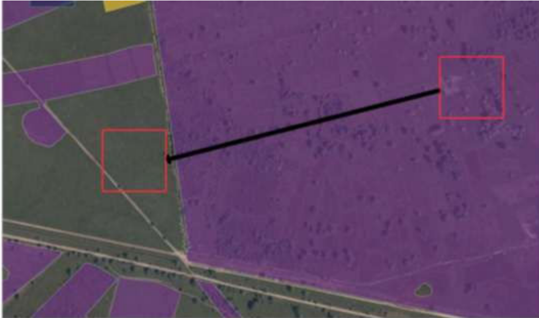
Figuur 1. De oude en nieuwe locatie van het drinkven. De paarse kleur geeft het habitatype droge heide weer, vochtige heide is met geel weergegeven. (Aerius Calculator)