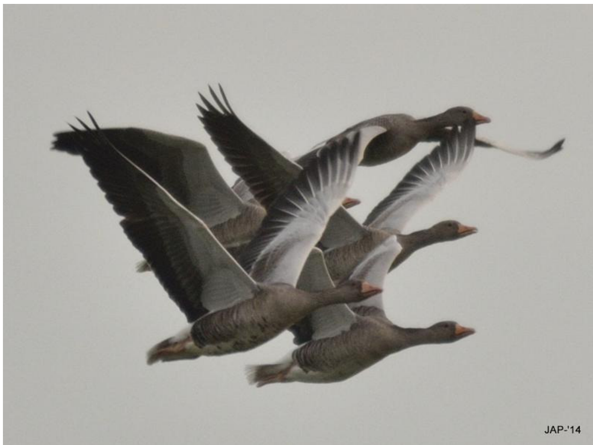
overvliegende grauwe ganzen

Ontheffing: Overzomerende ganzen Specificatie: Grauwe ganzen (anser anser), brandganzen en kolganzen Periode: 1 februari 2014 tot 1 november 2014 Zaaknummers: 2010-005945/46/47