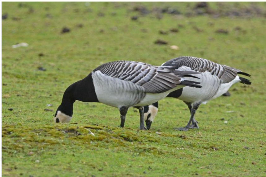
Foto: brandganzen

De belangrijkste punten (o.a. de conclusies en aanbevelingen) van iedere deelrapportage (rapportage per diersoort en eventueel per specificatie) komen in het jaarlijks inhoudelijk verslag weer aan de orde.