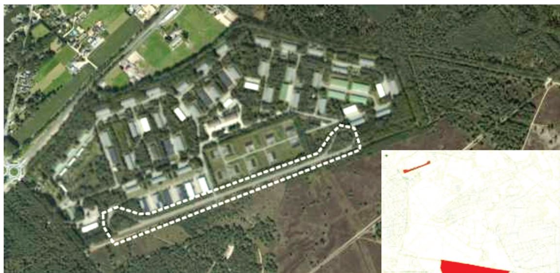
Parkeerlocatie op het MOB complex Ede-Driesprong