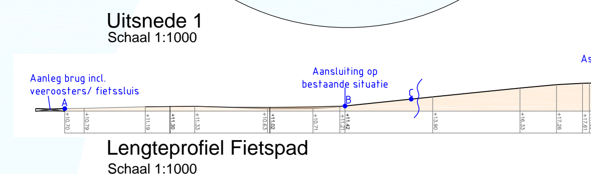
Lengteprofiel Fietspad Schaal 1:1000