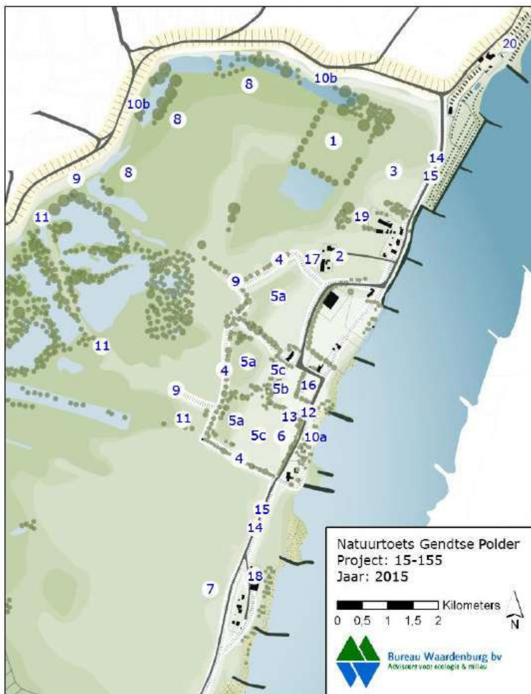
Figuur 1. Huidige situatie met inrichtingsmaatregelen Oeverwal Gendtsche Polder

Voor het ophogen van terreinen wordt grond gebruikt dat elders in het project wordt ontgraven. Daarnaast wordt in totaal 19.750 m 3 zand en klei van buiten het gebied aangevoerd. Deze aanvoer geschiedt per as of per boot. Ten behoeve van de aanvoer per boot wordt ter hoogte van maatregel 16 een aanlegsteiger gebouwd.