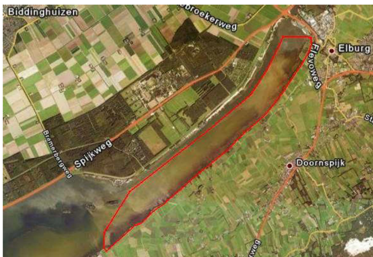
Afbeelding 1: Winterafsluiting Veluwemeer ex artikel 20 Natuurbeschermingswet 1998

Rustgebied winterafsluiting ax. Art 20 Nbw