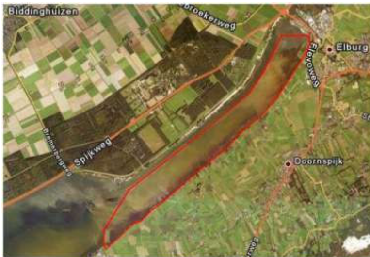
Afbeelding 1: Winterafsluiting Veluwemeer ex artikel 20 Natuurbeschermingswet 1998

Rustgebied winterafsluiting ax. Art 20 Nbw