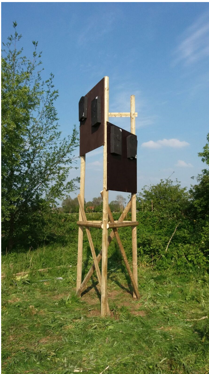
Figuur 2: Tijdelijke (platte) vleermuiskasten ter vervanging van de zomerverblijfplaats van de Gewone dwergvleermuis.