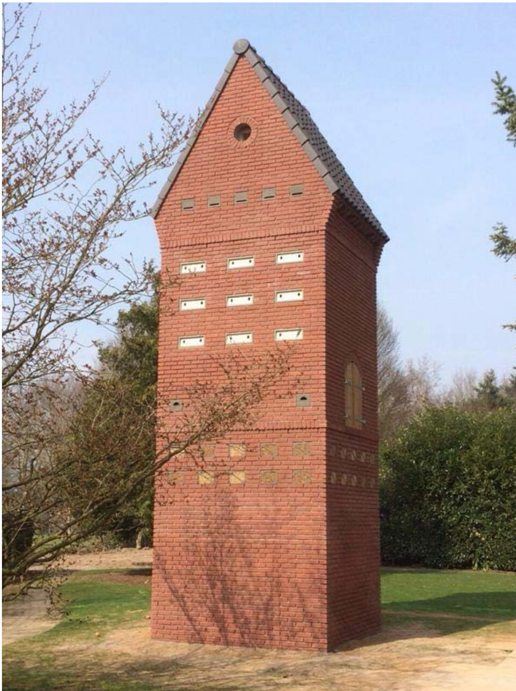
Figuur 4: Voorbeeld van een permanente vleermuistoren, zoals voorgesteld in maatregelen als nieuwbouw niet binnen tien jaar plaatsvindt.