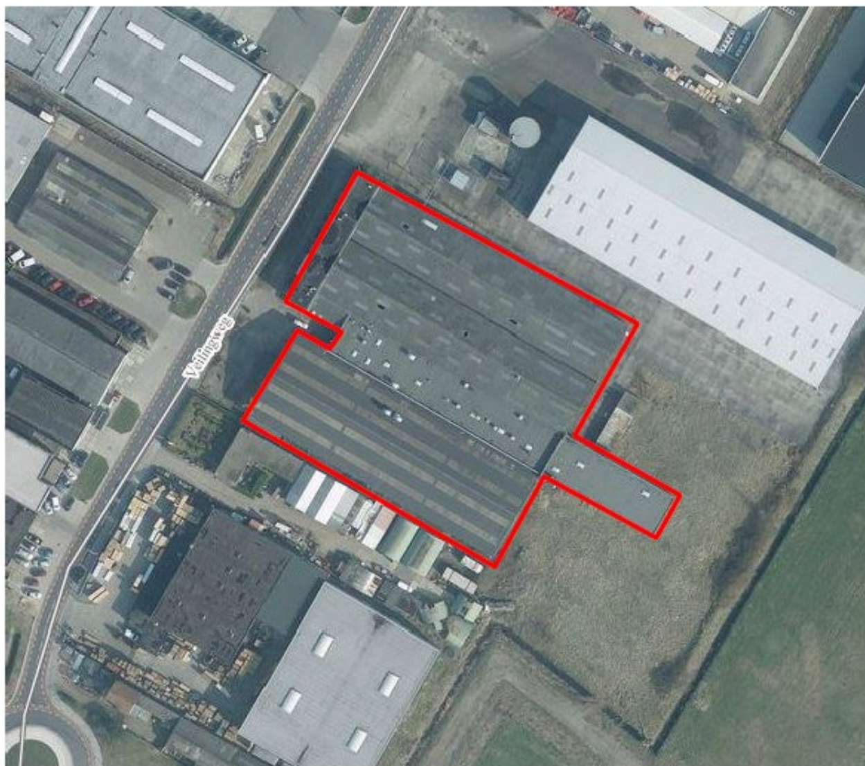
Figuur 1 Te slopen bebouwing aan de Veilingweg 9 te Zaltbommel (rood omlijnd)