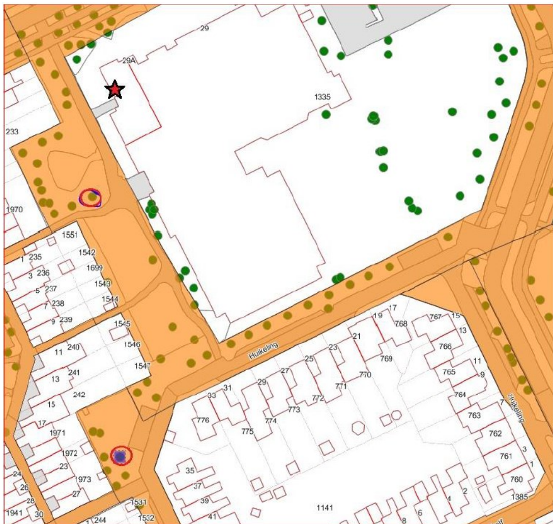
Locatie steenmarterkasten (rood omcirkeld) en locatie huidige verblijfplaats Steenmarter (rode ster)