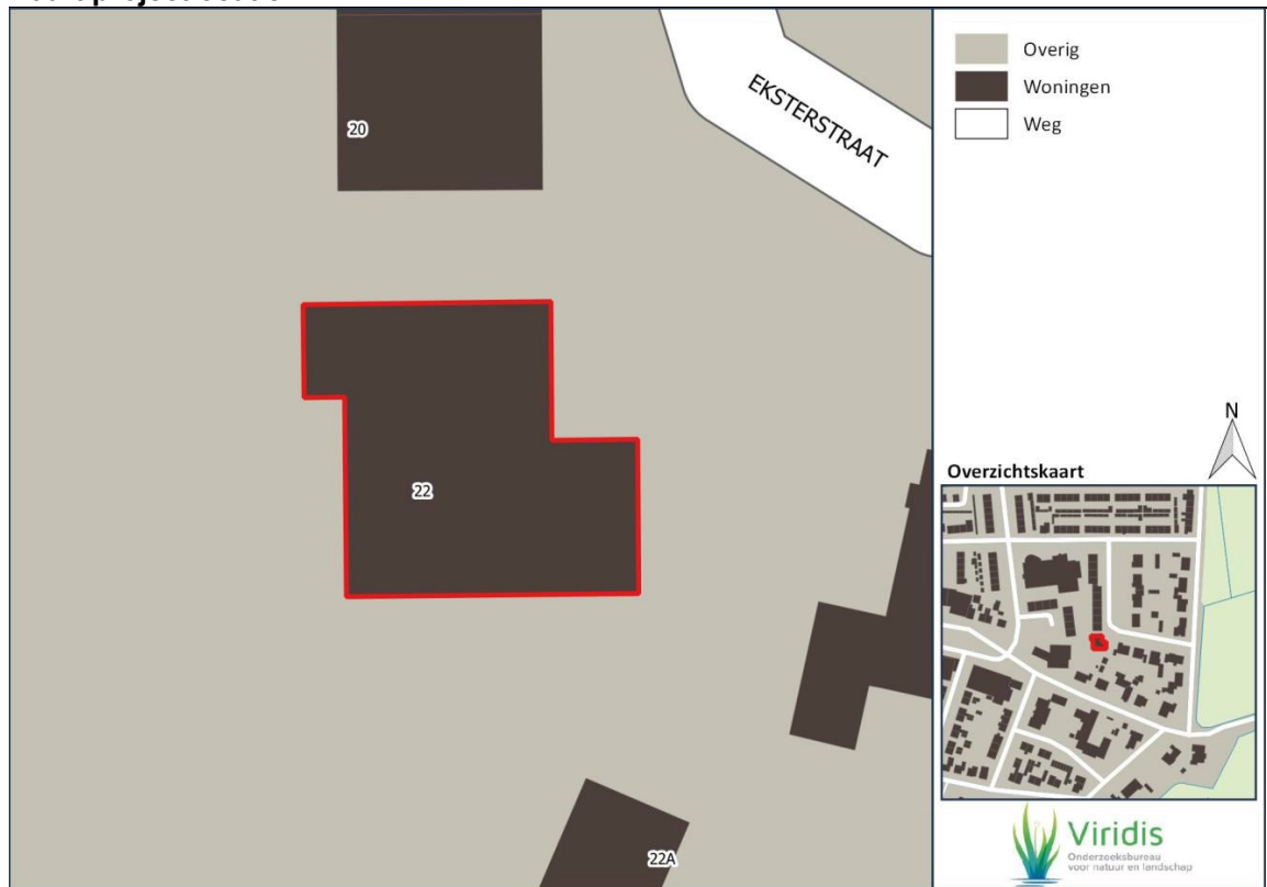
Figuur 1: Ligging van projectlocatie Eksterstraat 22 te Vuren en ligging in de wijk (rood omkaderd).