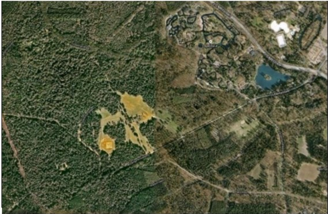
Bosweide (gelige vlek links van midden).