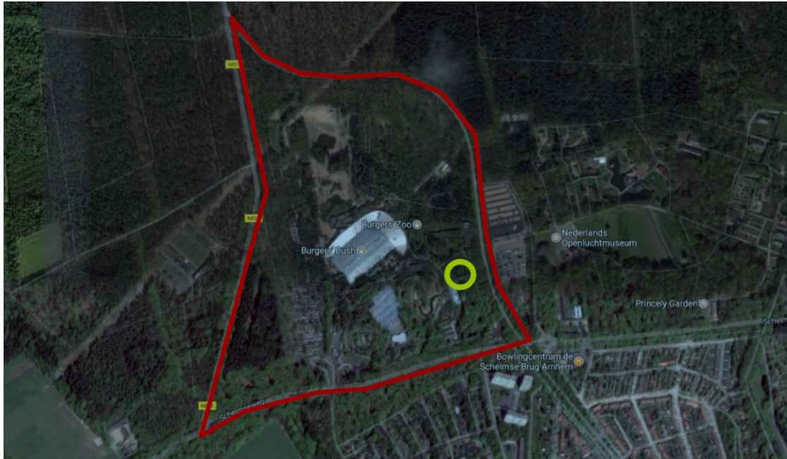
Figuur 1 Luchtfoto met locatie plangebied (groene cirkel)