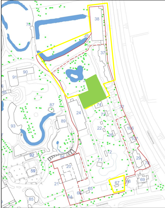
Figuur 2 Plangebied (groene markering)(rood is oorspronkelijk plangebied, geel betreft fase 2)