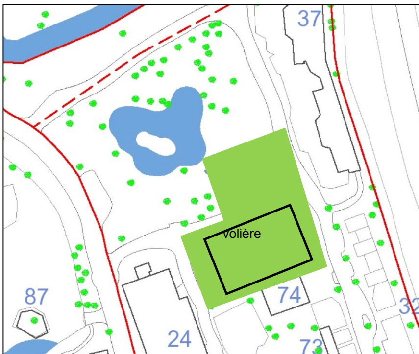
Figuur 3 Verblijven in het groene deel (gebouw 33, 34 en de volière voor de gieren (De Vrije Vlucht) waarop deze ontheffingsvraag betrekking heeft