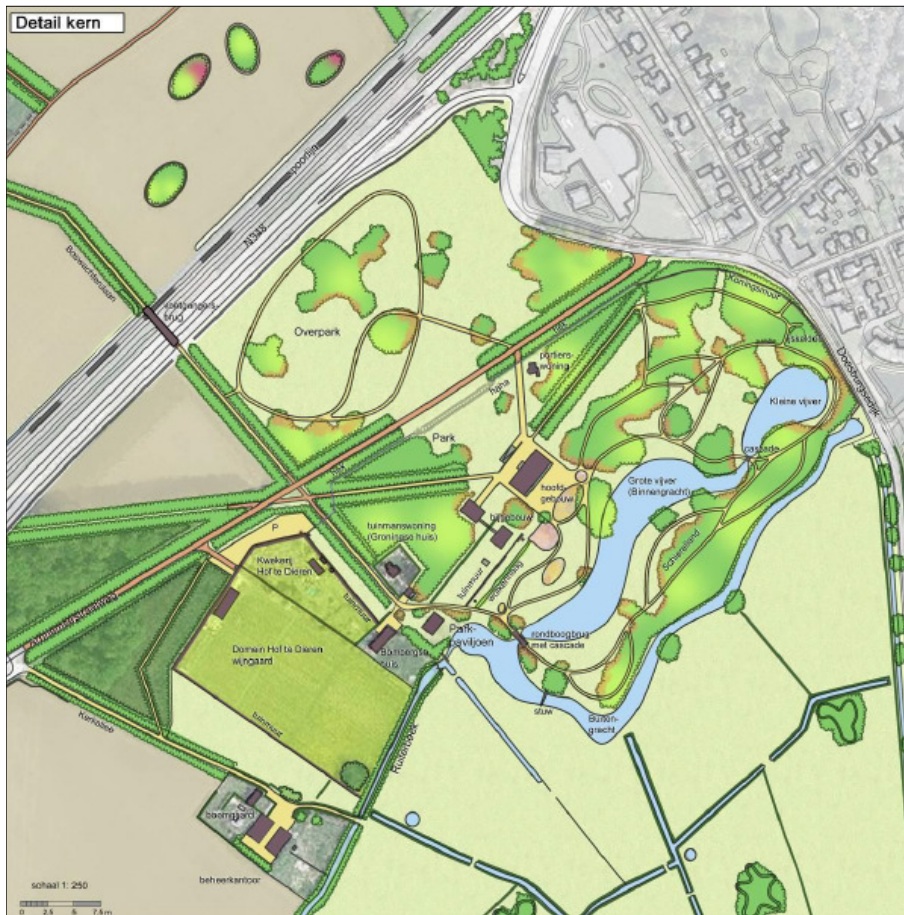
Figuur 1. Ligging plangebied