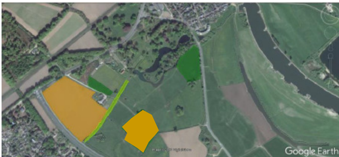
Kaart 1: Compenserende maatregelen. Oranje perceel: Akker met biologische graanteelt, lichtgroen: Fruitbomen tussen aanwezige knotbomen, donkergroen: Bemest grasland (bij voorkeur met vee).

Op kaart 1 is aangegeven waar de compenserende maatregelen worden uitgevoerd.