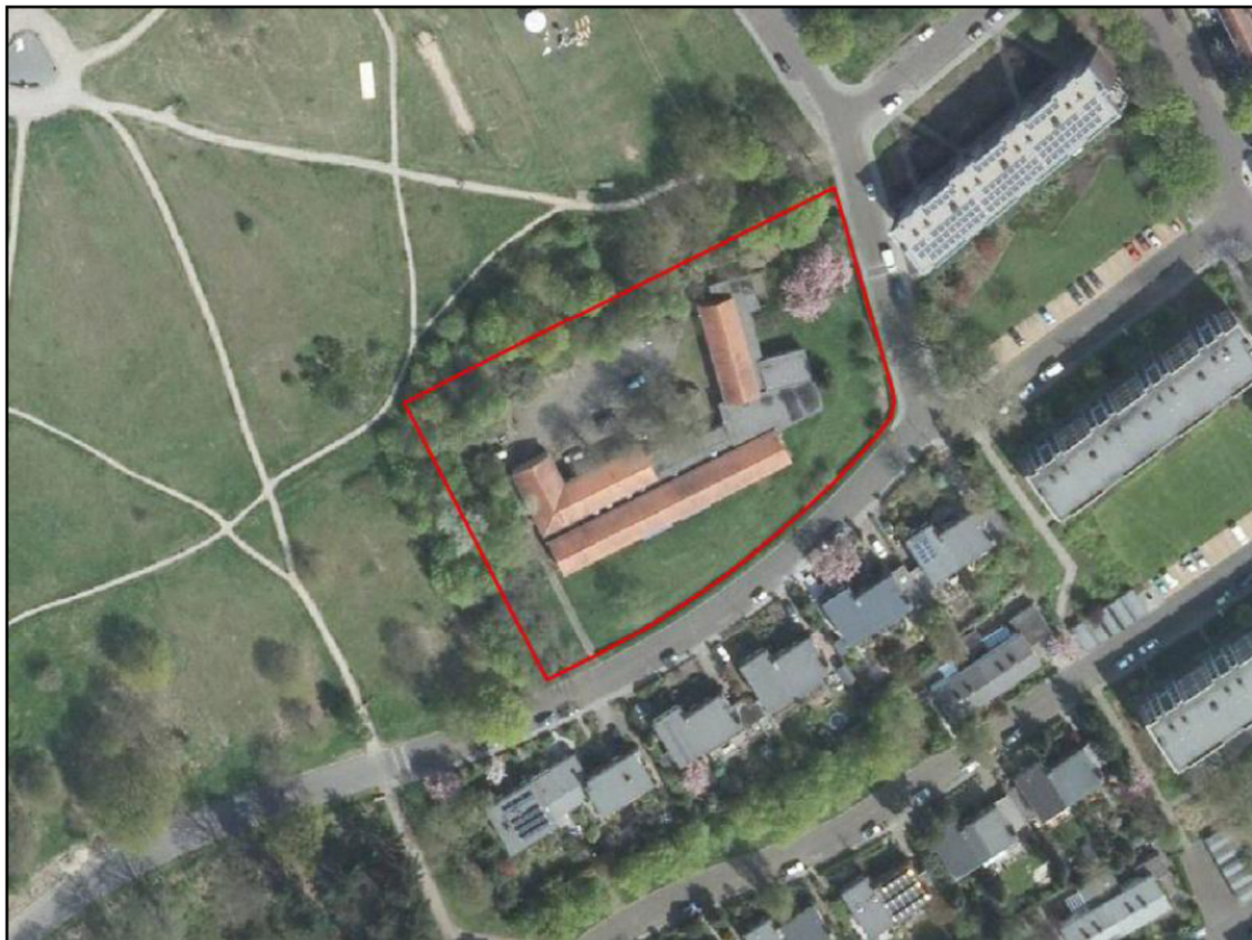
Figuur 1. Ligging en begrenzing plangebied Dominee Bechtlaan 1 te Arnhem (rode lijn). Het slopen van de bebouwing maakt geen onderdeel uit van deze ontheffing.