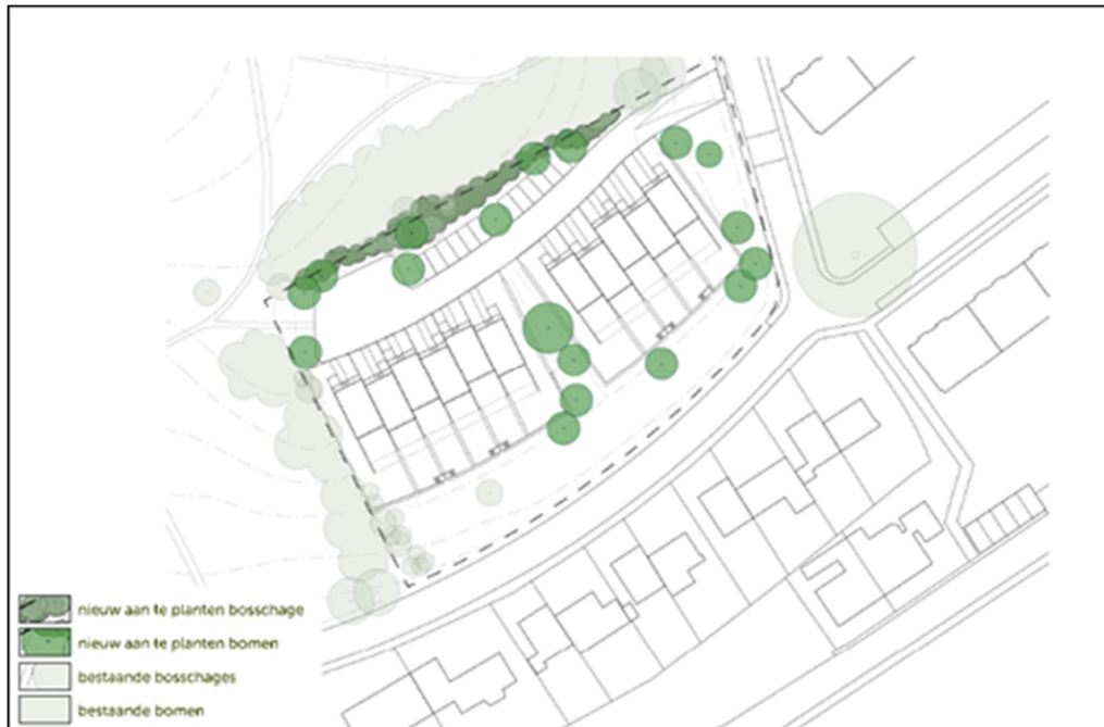
Figuur 3. Stedenbouwkundige visie aanplant bomen en bosschage.