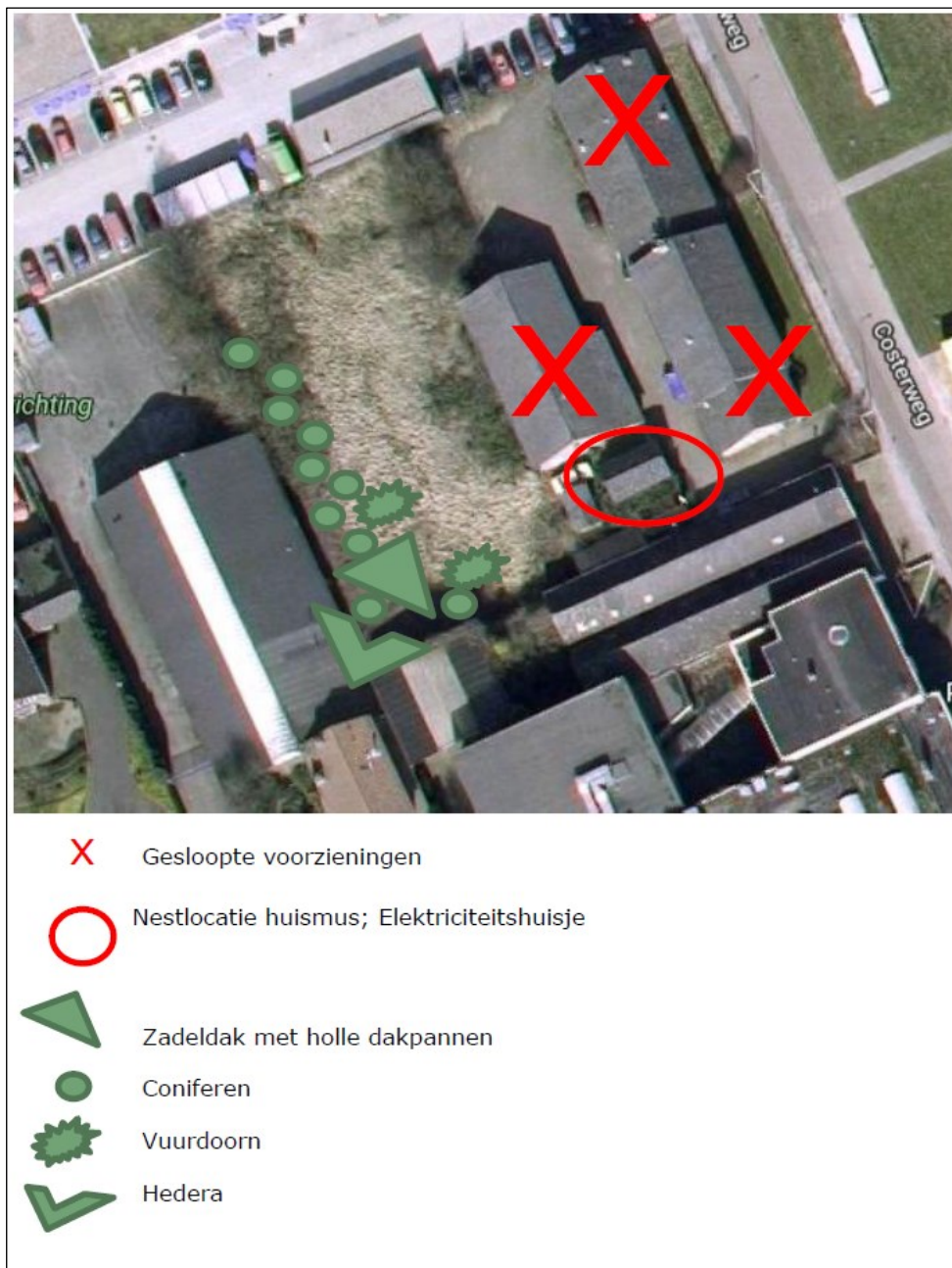
Figuur 2: Tijdelijke voorzieningen ten behoeve van de Huismus in relatie tot de huidige nestlocatie en de reeds gesloopte panden.