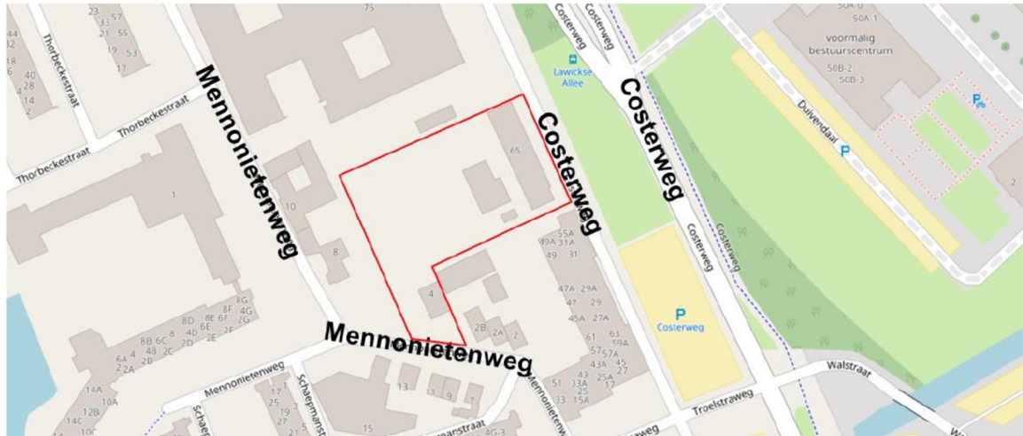
Figuur 1: Ligging van de planlocatie aan de Costerweg 65 te Wageningen.