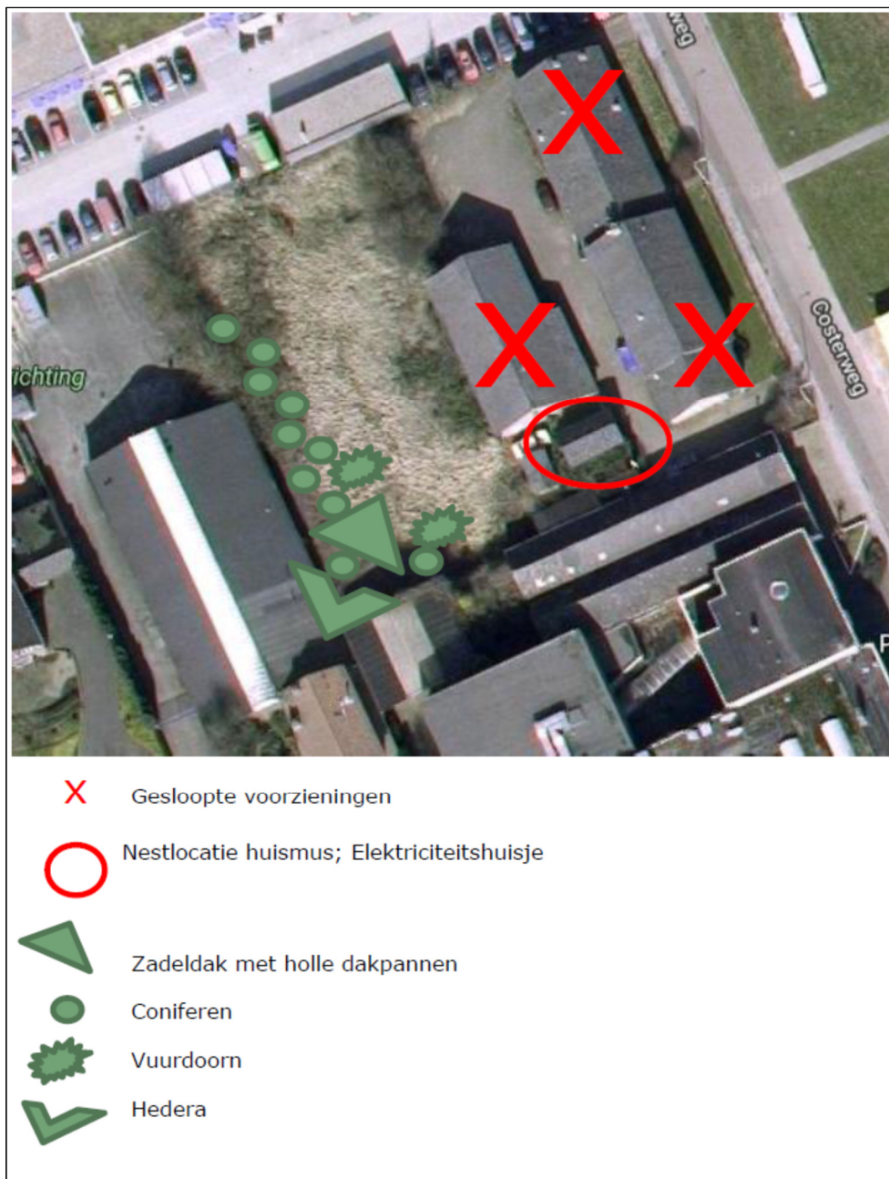
Figuur 2: Tijdelijke voorzieningen ten behoeve van de Huismus in relatie tot de huidige nestlocatie en de reeds gesloopte panden.