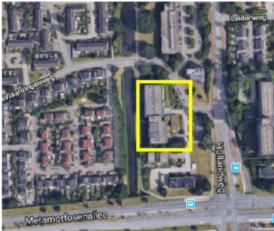
Figuur 1. Kaart plangebied (geel omkaderd).