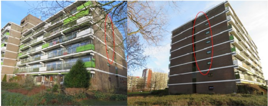
Figuur 2. Locatie permanente mitigatie in de vorm van spouwmuurcompartimenten (aangegeven met rode ellips). Links: zuidgevel, rechts: noordgevel.