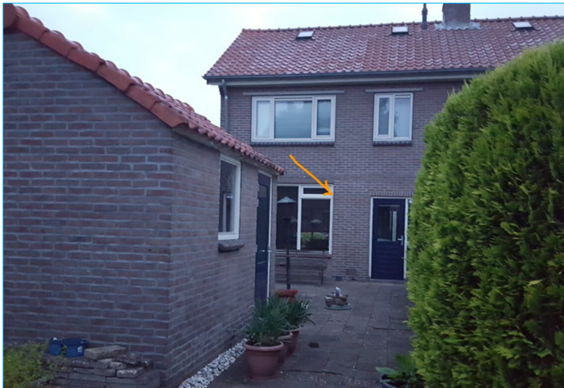
Figuur 2: Invliegplek gewone dwergvleermuis, Berkenlaan 2