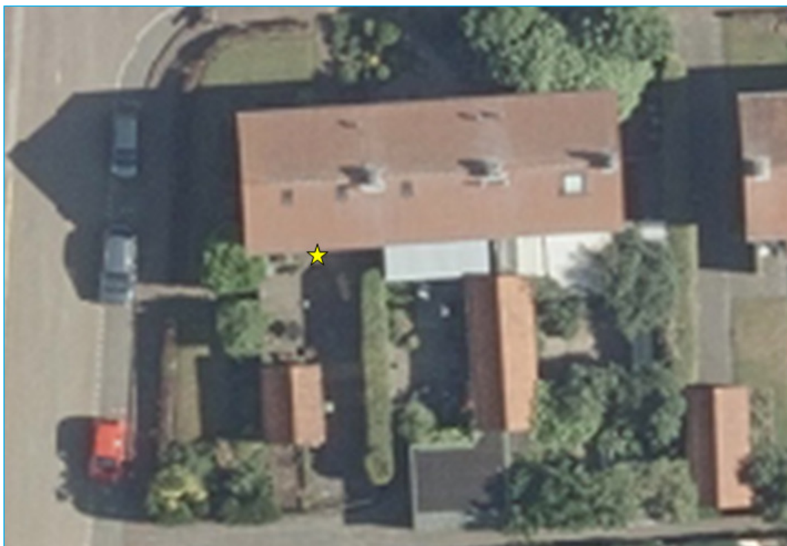
Figuur 1: Plangebied Berkenlaan 2, 4 en 6 te Warnsveld Gele ster: zomerverblijf gewone dwergvleermuis bij Berkenlaan 2