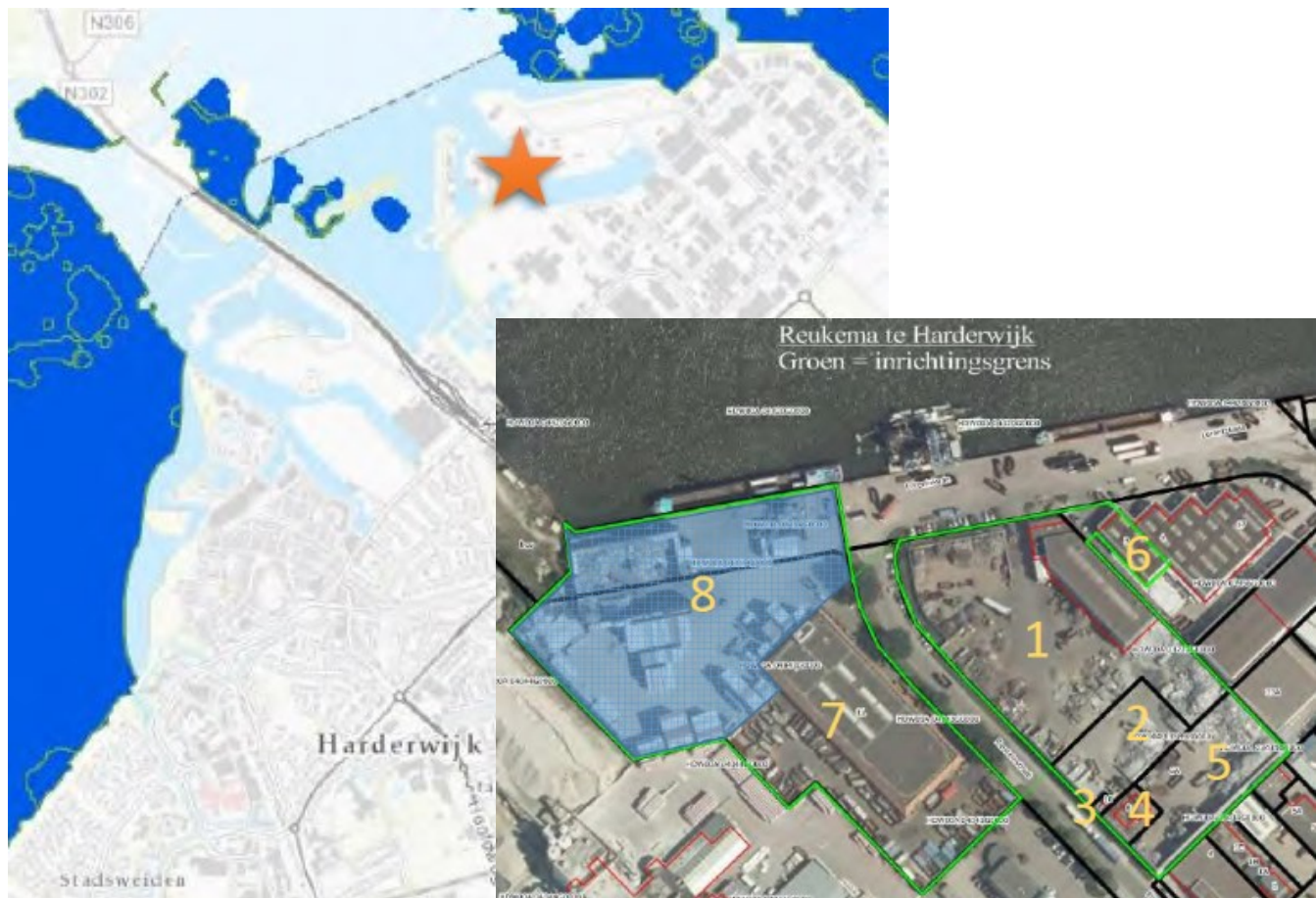
Figuur 1 Ligging plangebied (oranje ster) en begrenzing plangebied (groen omlijnd)